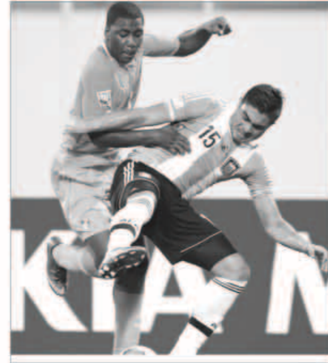
مواجهات قوية اليوم