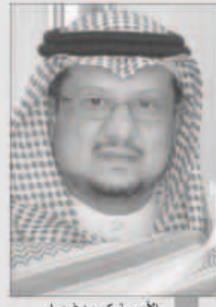
الأمير تركي بن فيصل

وقال رئيس النصر في تصريح تلفزيوني بعد فوز العالمي على الانتصار بثلاثة