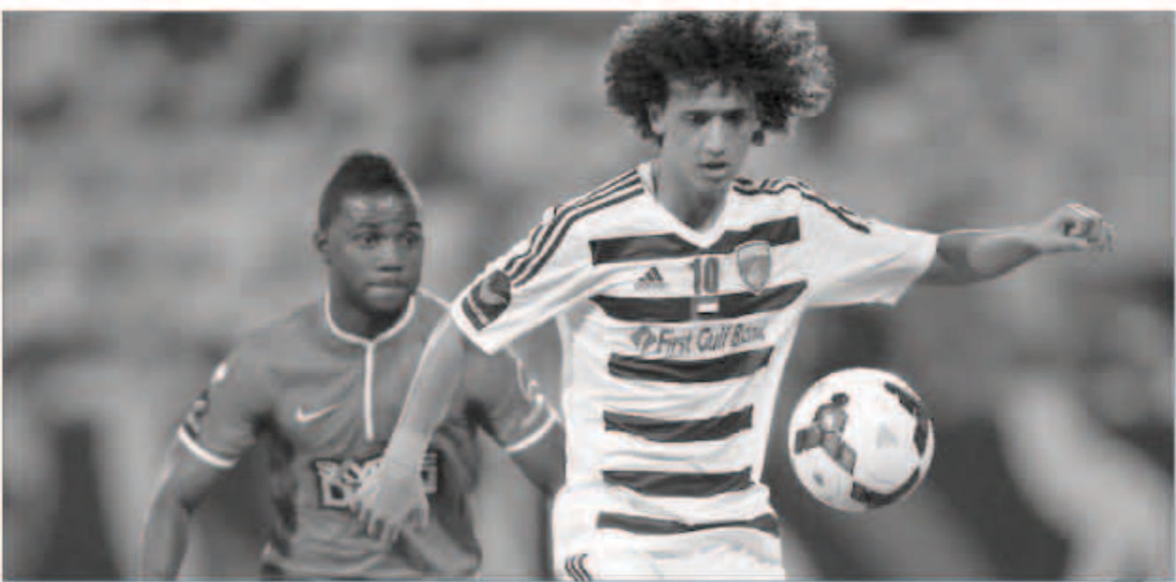
الجماهير ترتقب عودة عموري لسابق مستواه

يواجه العين حامل اللقب العديد من الصعوبات هذا الموسم وتحديداً انتصارين على التوالي للمرة الأولى هذا الموسم في دوري المحترفين الإماراتي لكرة القدم قد يعطي دفعة قوية لفريق المدرب الإسباني كيكي سانشيز فلوريس.