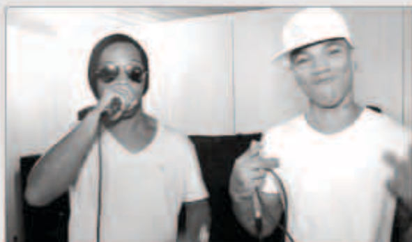
رونالدينيو مع صديقه ديسيتي

بعد أن أثبت نجوميته على مدار أعوام طويلة داخل المستطيل الأخضر كواحد من أبرز لاعبي كرة القدم البرازيلية، انتقل رونالدينيو إلى عالم الفن ليكشف عن موهبته في الغناء حيث قدم أغنية ديوتو مصورة مع صديقه مطرب الراب ديسيتي، وسجلت مشاهدات عالية في الساعات الأولى لعرضها.