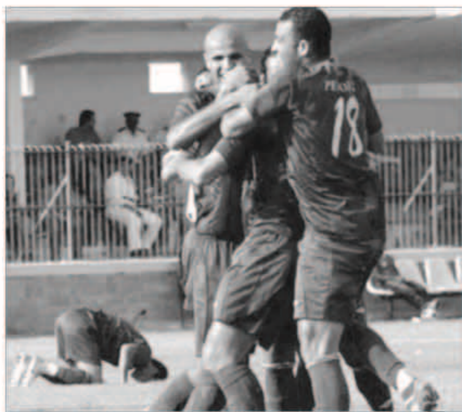
من مباراة بتروجيت مع الزمالك