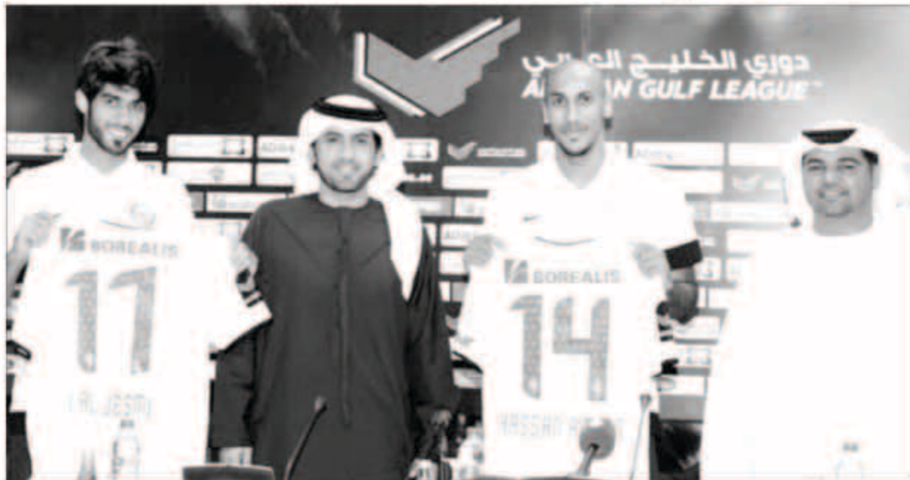
جانب من اللاعبين الصباحية

بما يليق بسمعة ومكانة النادي وبما يليق طموحات مجلس الإدارة والمشجعين وبما يرضي جهازه الفني وزملائه الجدد. وأكد أن أولى أهدافه الاحترافية كانت الانضمام للفريق بنافس دائما على الألقاب محليا وأسيويا، وأوضح أن انضمامه للجزيرة ضمن له تحقيق هذا الهدف بأفضل طريقة ممكنة، مؤكدا أيضا أن الجزيرة سيضمن له تحقيق هدفه الثاني، وهو الانضمام للترشيح الأول في المستقبل القريب.