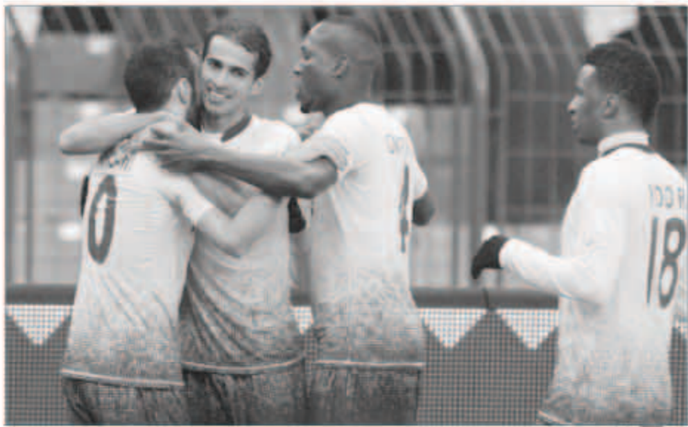
لاصوا النصر السعودي

تتربق الأوساط الرياضية في السعودية الدبري المنتظر بين النصر والهلال على استاد الملك فهد الدولي في الرياض اليوم في قمة مواجهات الجولة الثالثة والعشرين للدوري السعودي وتعتبر المباراة «بطولة» في حد ذاتها بعيدا عن كونها تنافسية لتكون نتيجتها تمهيد للفريقين. فالتصريح يظهر للمواجهة على أنها مباراة العمر بالنسبة له حيث أن الفوز أو التعادل سيؤدي لتحقيق اللقب بصفة رسمية للمرة السابعة في تاريخه بعد غياب دام 19 عاماً ودون التظلم لنتائج مبارياته المتتالية وفي نفس الوقت تأكيد أفضليته على جاره هذا الموسم.