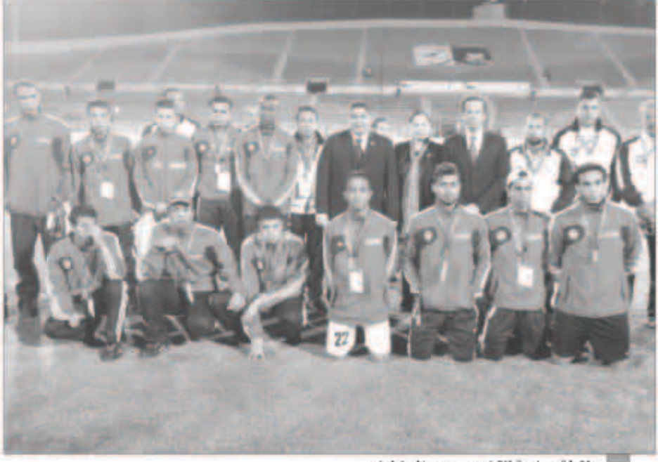
لحظة جماعية لمنتخب مصر مع المسؤولين