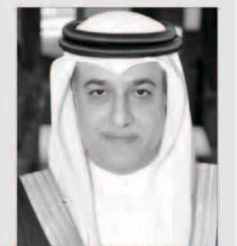
الشيخ سلمان بن إبراهيم

يخطط الإتحاد الآسيوي لكرة القدم لزيادة عدد الفرق المشاركة في نهائيات كأس آسيا للعبة الشعبية إلى 24 منتخبا بدلاً من العدد الحالي وهو 16 منتخبا. وتأتي هذه الخطة في إطار تغييرات تهدف إلى رفع عدد المباريات الدولية للمنتخبات الآسيوية. وقال الشيخ سلمان بن إبراهيم آل خليفة رئيس الإتحاد الآسيوي لكرة القدم في بيان «أنا على ثقة بأن التغييرات التي ستتم سيكون لها تأثير كبير على الكرة الآسيوية وستصعب في صالح الدول الأعضاء في الإتحاد».