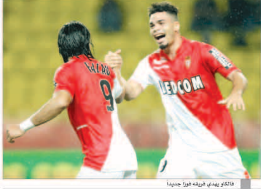
فالكاو يهدي فريقه فوزاً جديداً

استعاد موناكو صدارة دوري الدرجة الأولى الفرنسي سريعا بفوزه الكبير على متعبيه لويس الثاني أمام باسيتيا بثلاثة نظيفة، ضمن الجولة السابعة من المسابقة. ورفع موناكو رصيده إلى 17 نقطة، ليتفوق بفارق نقطتين عن حامل اللقب باريس سان جيرمان الذي فاز على فالينسيان 1-صفر، وبثلاث نقاط عن مارسيليا. تألق في اللقاء الـ«تمر» الكولومبي راداميل فالكاو بتسجيله هدفين في الدقيقة 41 و89، وسيفه المهاجم إيمانويل ريفيري بهدف «39». وبهذا المعدل يتربع فالكاو على قمة هدافي الليغ برصيد سبعة أهداف، ومتقدماً بفارق هدف عن زميله ريفيري. ويعد الانتصار هو الخامس لموناكو الذي لم يخسر أي مباراة حتى الآن، حيث تعادل مرتين أمام تولوز وسلبيا وباريس سان جيرمان بهدف لثلاثة، ليحافظ على رصيده خالياً من الهزائم مع حامل اللقب الذي تعادل في ثلاث مناسبات. وبهذا النتيجة يستقر باسيتيا في المرتبة الثالثة عشرة برصيد ثمان نقاط.