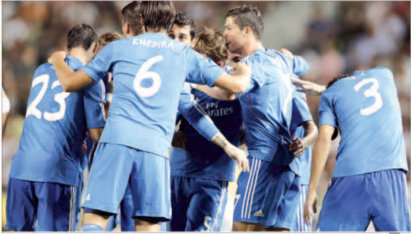
فرحة لاعبي الريال بالفوز الصعب

فوز درامي حققه ريال مدريد على الصاعد إلتشي بهدفين في الجولة السادسة من منافسات الدوري الإسباني في المباراة التي أقيمت على ملعب مانويل فالكو. نجح رونالدو في تسجيل الهدف الأول للريال في الدقيقة 51 من ركلة مباشرة من خارج منطقة الجزاء في حين تعادل الغاني بواكي إلتشي في الدقيقة الأولى من الوقت بدل الضائع ثم تعقد المباراة رأساً على عقب بعد أن احتسب ركلة جزاء لريال مدريد بدلاً من احتساب خطأ لصالح إلتشي بسبب عرقلة بيبي للاعب النادي المستضيف لتتهزم للاحتجاجات على حكم اللقاء ولكن دون جدوى ليسد رونالدو الركلة ويسجل الهدف الثاني في الدقيقة الرابعة من الوقت بدل الضائع. ارتفع رصيد الريال إلى 16 نقطة في المركز الثالث في حين قبع إلتشي في المركز الثامن عشر في جدول ترتيب الدوري الإسباني. لعب الإيطالي كارلو أنشيلوتي المدير الفني لريال مدريد مباراة إلتشي بتشكيلة هجومية من أجل حسم المباراة مع الفريق الصاعد حديثاً، مكرراً حيث دفع في وسط اللعب بالكرواتي لوكا مودريتش والإرجنتيني أنخيل دي ماريا والإسباني إيسكو والبرتغالي كريستيانو رونالدو وفي الهجوم الفرنسي كريم بنزيمة في حين استمر حارس إيكاسياس بدلاً لبيدغو لوبيز صاحب القعد الأساسي لحراسة عرين النادي الملكي.