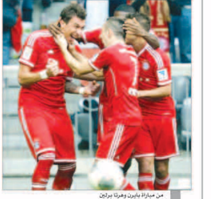
من مباراة بايرن هيرتا برلين

ورفع ليفركوزن رصيده إلى 25 نقطة في المركز الثالث بفارق الأهداف