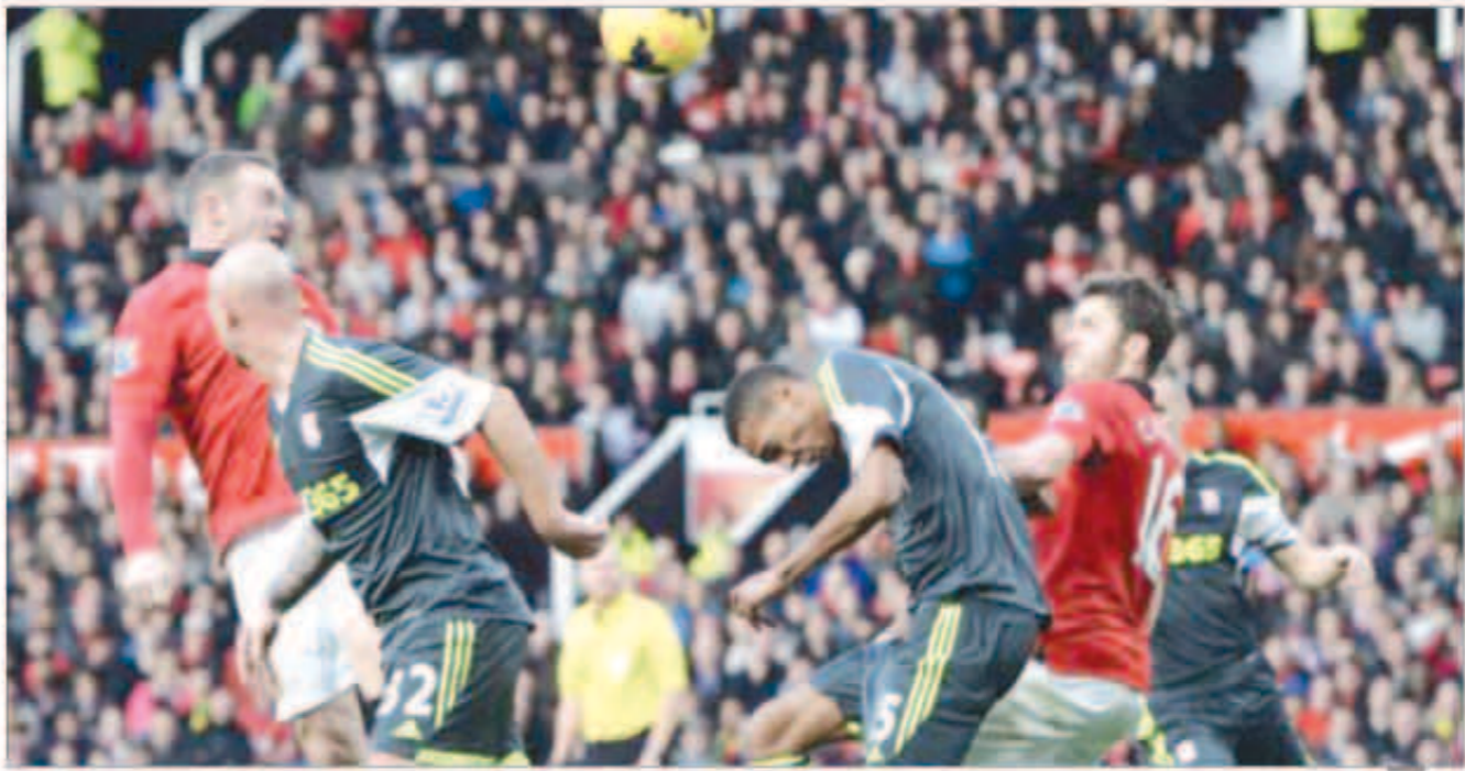
صراع على الكرة

وكان السير الاسكتلندي حاضرا في مسرح الاحلام «اولد ترافورد» لمشاهدة اللقاء ووضح عليه القلق في الشوط الأول نظرا لتفوق الضيوف لعيا ونتيجة، إلا أن خرج مرتاحا بعد أن حول الشياطين النتيجة إلى الفوز «2-3»، وانفردت تغيرات ديفيد موييس مدرب المانوي في تعديل الاوضاع وجذب فريزه أسوأ بداية له في الدوري الإنكليزي. كان ستوك سيتي الطرف الأفضل والأكثر خطورة في الشوط الأول، وباعت الضيوف أصحاب الأرض بهدف مبكر جاء عن طريق بيتر كراوتش الذي استغل كرة عرضية مقلقة من زميله