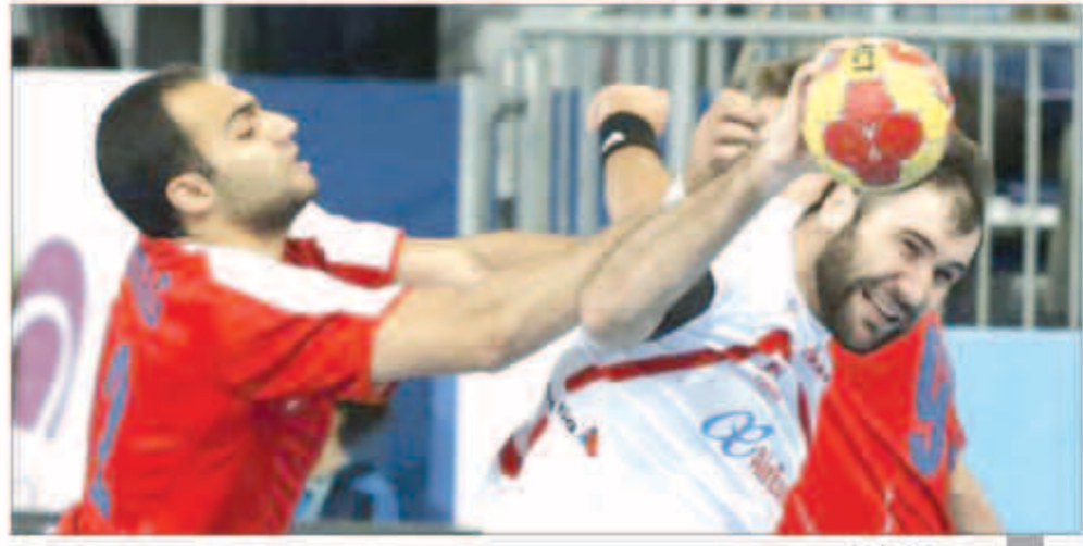
من مباراة سابقة

أكد برنهارد بوهر رئيس الاتحاد الألماني لكرة اليد أنه يشعر بسعادة غامرة للقرار الاتحاد الدولي للعبة بشأن منح بلاده حق استضافة بطولة كأس العالم للرجال عام 2019 بالتنظيم المشترك مع الدنمارك وهو ما يعكس ثقة الاتحاد الدولي في ملف البلدين. وقال بوهر ، في تصريحات خاصة إلى وكالة الأنباء الألمانية «د.ب.أ» اليوم ، «سعادتي لا توصف حيث نجحنا في نيل شرف تنظيم مونديال 2019 وكنا نرصد منذ البداية أن حظوظنا ستكون قوية وسنحظى بقبول أعضاء اللجنة التنفيذية للاتحاد الدولي. العمل سيبدا منذ الآن لإعداد العدة لهذا الحدث الكبير وسنعمل سويا حتى نؤكد قدرتنا على تنظيم بطولة متميزة رغم المنافسة القوية التي ستفرض علينا بحكم العمل الكبير الذي يقوم به الحائز القطري من أجل تنظيم بطولة غير سيولة» في مونديال 2015». وعن التخوفات من حصول مشاكل ناجمة عن تنظيم البطولة في بلدين مختلفين ، قال «لهم أن تعمل كاتحادين بنفس الرؤية والتوجه