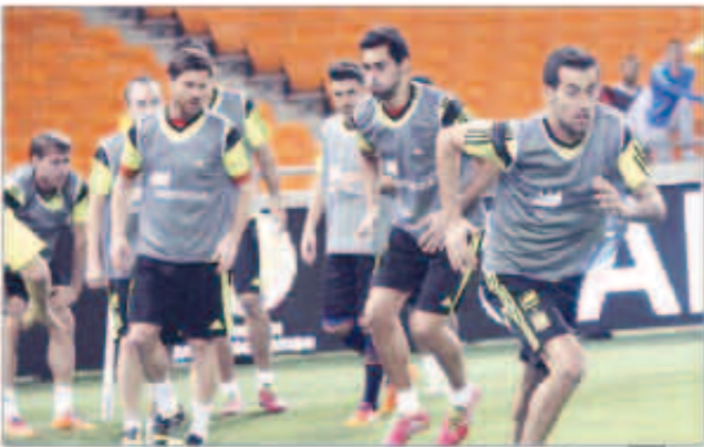
من تدريبات برشلونة

صرح سرجيو بوسكيتس، لاعب وسط فريق برشلونة ومنتخب إسبانيا، بأن حارس المرمى إيكير كاسياس يبذل جهداً أكبر في المران الآن مع المانادور مقارنة بالسابق. وفي مقابلة أجراها مع أحد برامج محطة «أوندا ثيرو» الإذاعية الإسبانية، قال بوسكيتس: «كاسياس يبذل جهداً أكبر الآن في المران، هو نوما يجعل بجد ولكنه كلف جهده حالياً. عاجلاً أم آجلاً سيحقق ما يسعى إليه وسيدخل النهضة على نفوسنا جميعاً».