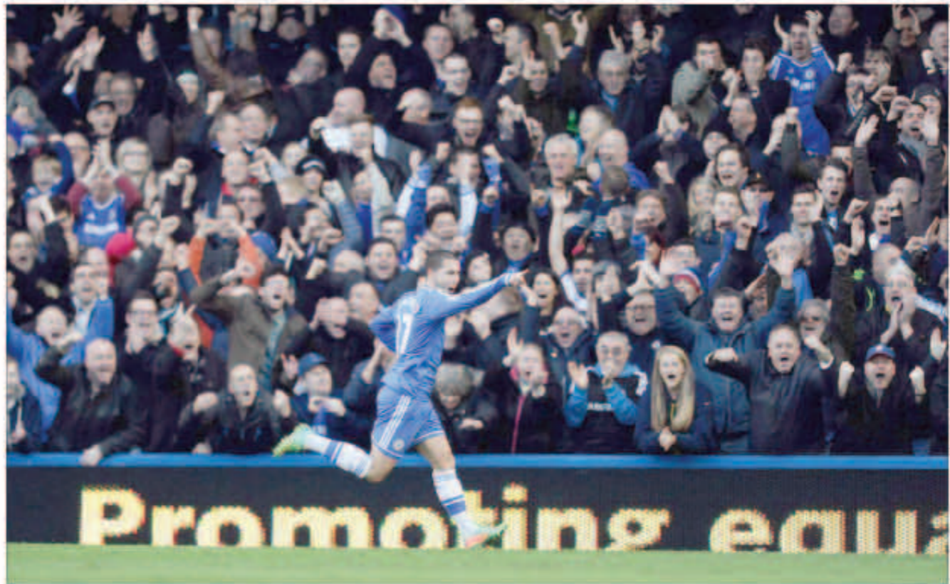
هازارد يحتفل بنتائجه

هاتريك سجله البلجيكي إدين هازارد، فتح الطريق لتشيلسي ليتربع على قمة الدوري الإنكليزي ، بعد فوزه على نيوكاسل بثلاثة أهداف نظيفة ، في اللقاء الذي جرى بملعب ستامفورد بريدج بالجولة «25» من البطولة. أهداف إدين هازارد الثلاثة جاءت في الدقائق «-27، 34، 63» ، وكرة جزاء- ، ليرتفع رصيد تشيلسي إلى «56» نقطة ، فيما توقف رصيد نيوكاسل عند «37» نقطة في المركز الثامن. بداية ساخنة شهدتها المباراة ، حيث حاول تشيلسي التسجيل مبكراً وهدد مرسي نيوكاسل بتسديدة بعد اختراق في الدقيقة الثانية من هازارد وقف لها تيم كرول بالمرصاد ، ثم تسديدة من لامبارد في الدقيقة الرابعة ، وأعلن نيوكاسل عن نفسه عن طريق محاولة موسي سيسوكو ثم محاولة من حاتم بن عرفة بتصويبه من داخل منطقة الجزاء في الدقيقة التاسعة تصدى لها بيتر تشك ، وظفر كرول براعة كبيرة في الدقيقة «11» بالتصدي لصاروخ أرضي من لامبارد.