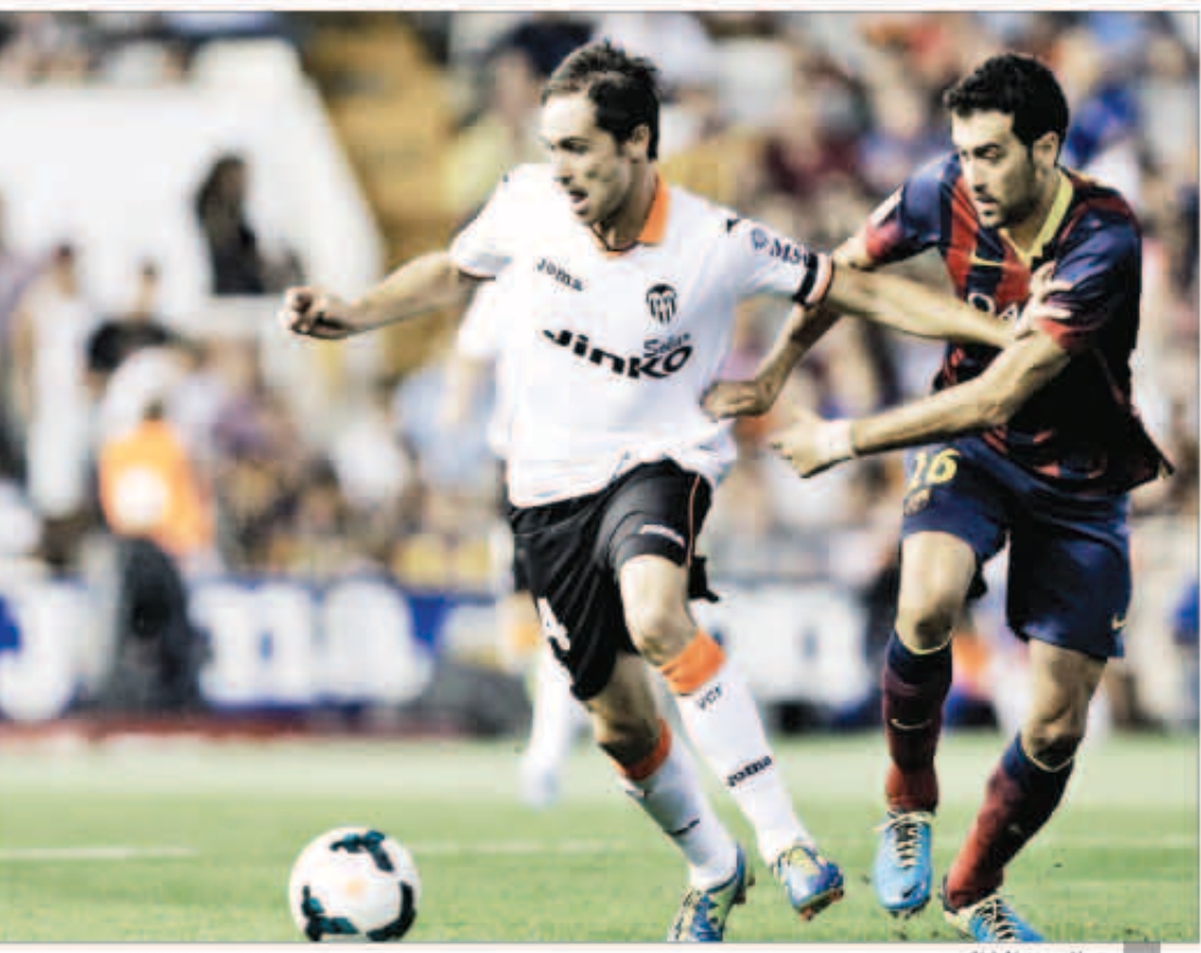
جانب من المباراة

أعلى أنتليكو مدريد صدارة الدوري الإسباني لكرة القدم بعدما تغلب على مضيفه ريال سوسيداد 2-1 في المرحلة الثالثة من المسابقة. وعلى ملعب سوسيداد، انتهى الشوط الأول بتقدم أنتليكو بهدف توفيق ديفيد فيا القادم من صفوف برشلونه في فترة الانتقالات الصيفية، في الدقيقة 27. وأضاف المهاجم الواعد كوكي الهدف الثاني لأنتليكو مدريد في الدقيقة 56 بمساعدة المئاتق فيا. وتكفل خافيير بريتو بتسجيل هدفًا شرقيًا لسوسيداد في الدقيقة 69 مستغلا تمريرة استييان جرانثيرو. ورفع أنتليكو رصيده إلى تسع نقاط محتلا الصدارة بينما تجمد رصيد ريال سوسيداد عند أربع نقاط في المركز الثامن. وفي مواجهة أخرى خيم التعادل السلبي على مباراة إسبانيول مع ضيفه ريال بيتيس ليرفع الأول رصيده إلى خمس نقاط في المركز السادس مقابل نقطة واحدة لريال بيتيس في المركز السادس عشر.