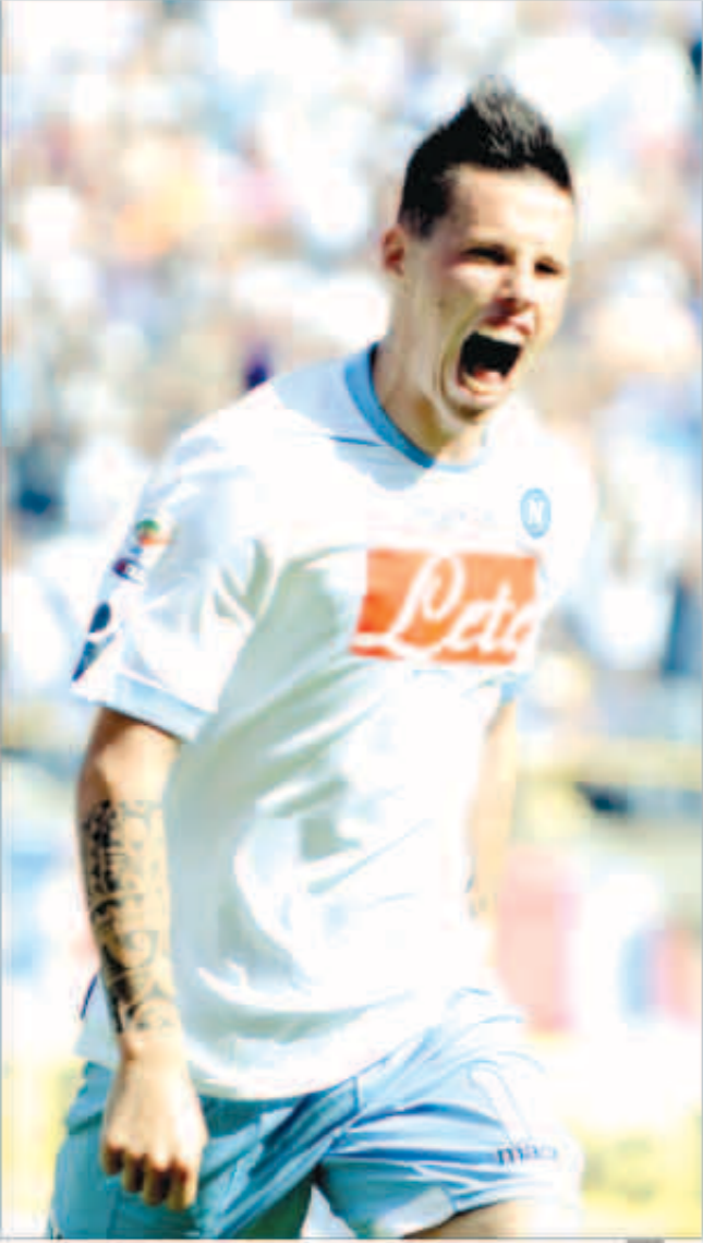
هامسيك نجم نابولي

الفريقين وضد أفراد الشرطة أيضاً، فإن ديربي روما يشكل قلقاً للسلطات الإيطالية التي تفكر في أن تلعب هذه المباراة الكبيرة بعيداً عن العاصمة الإيطالية لمنع الاشتباكات.