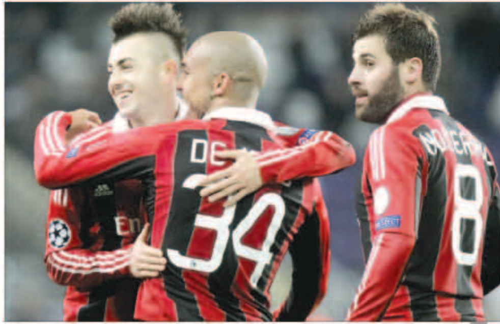
الميلا متحمس لقاء الصعب

ويلتقي ظهر اليوم بولونيا مع تورينو، وكاتانيا مع بارما وإتالاندا مع فيورنتينا.