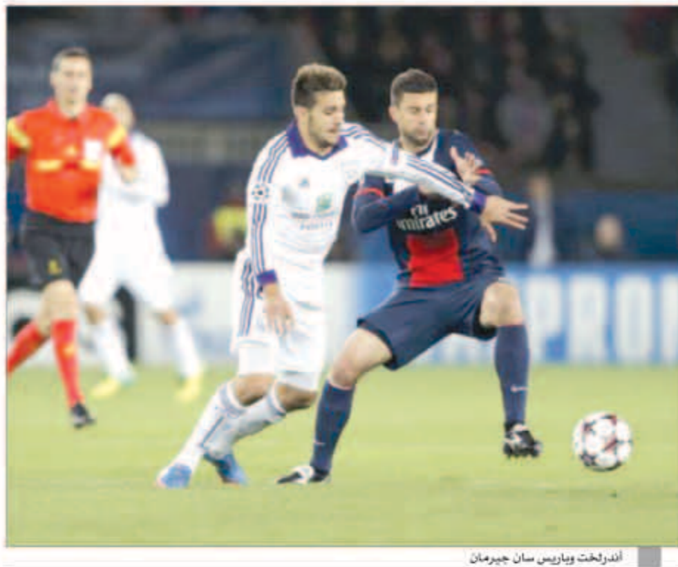
أندرلخت وباريس سان جيرمان

عجز باريس سان جيرمان عن تحقيق الفوز أمام أندرلخت بسبب تضيق المساحات من جانب الضيوف والتكتل الدفاعي من أجل الحفاظ على نقطة التعادل في ملعب الأهرام لينتهي اللقاء بالتعادل الإيجابي.