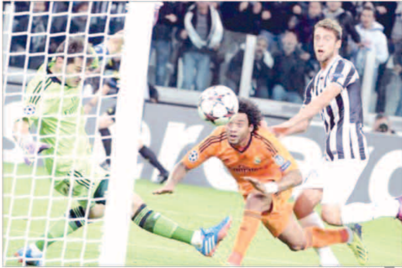
قمة إيطالية إسبانية مثيرة

لم يبرز في هجوم الريال سوى رونالدو الذي بذل جهداً كبيراً بفرده في الخط الأمامي لكنه لم يجد معاونة حقيقية من بيل وبينزيما الذين عادا للخياب من جديد. لجأ اليوفي للتسديد من الخارج عن طريق فيدال وبيرو وبوجيا وتيفيز بعد أن واجهوا صعوبة كبيرة في اختراق دفاع الريال، وهو ما