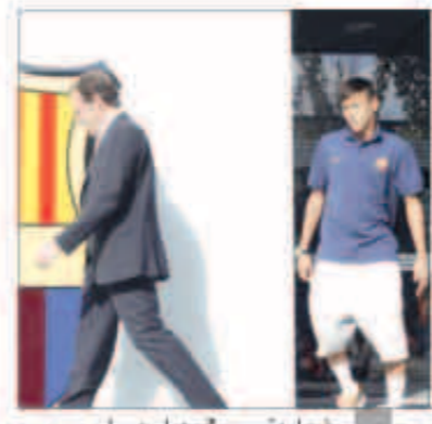
نيمار يتشعب مع رحيل روسيل

أبدت وسائل الإعلام الإسبانية دهشتها إزاء استقالة ساندرو روسيل من رئاسة برشلونة، وانتقدته لعدم إفصاحه عن أسباب «هروبه». وجاء عنوان «ماركا» «روسيل يهرب، والفضيحة تبقى». بعد أن أشارت إلى أن رئيس النادي كان «الضحية الأولى» في قضية نيمار. وبرزت الصحيفة التي تصدر من مدريد أن خليفة، جوسيب ماري بارتوميو، قريب من روسيل، وقع أيضا على عقود نيمار، بدورها شددت صحيفة «أس» على انتقاد روسيل لأنه لم يقدم