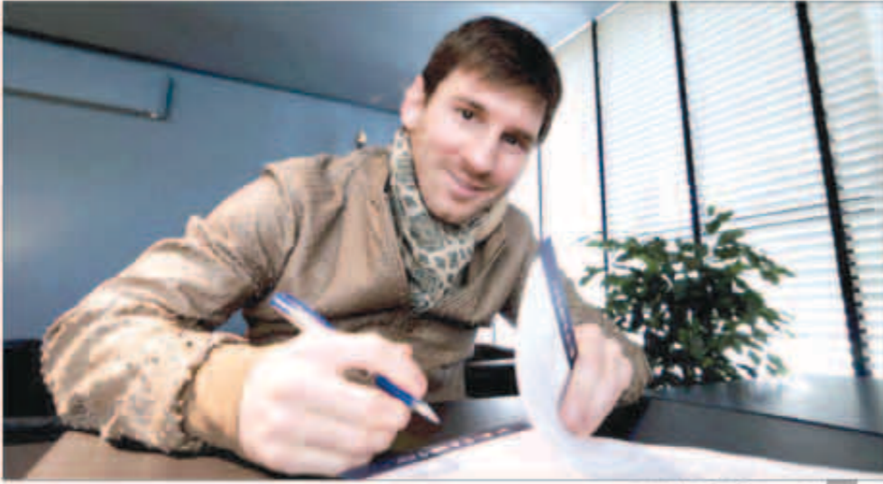
ميسي يوقع عقده الجديد

وبعد استقالة روسيل، تجديد عقد ميسي هو الآن أولوية وسينفذ قريباً لأن النادي الكتالوني لا يريد إطالة المسلسل وحسمه مبكراً قبل أن تصيد وسائل الإعلام المعادية لبرشلونة من صناعة أزمة قبل استئناف دوري أبطال أوروبا مشيرة ومترقبية مع مانشستر سيتي. يذكر أنه رغم تنويع النجم البرتغالي كريستيانو رونالدو بالكرة الذهبية قبل أيام، إلا أن غريمه ميسي لا يزال اللاعب الأعلى قيمة مادية في العالم للعام السادس على التوالي وفقا لإحصاءات شركة «بلوري» البرازيلية.