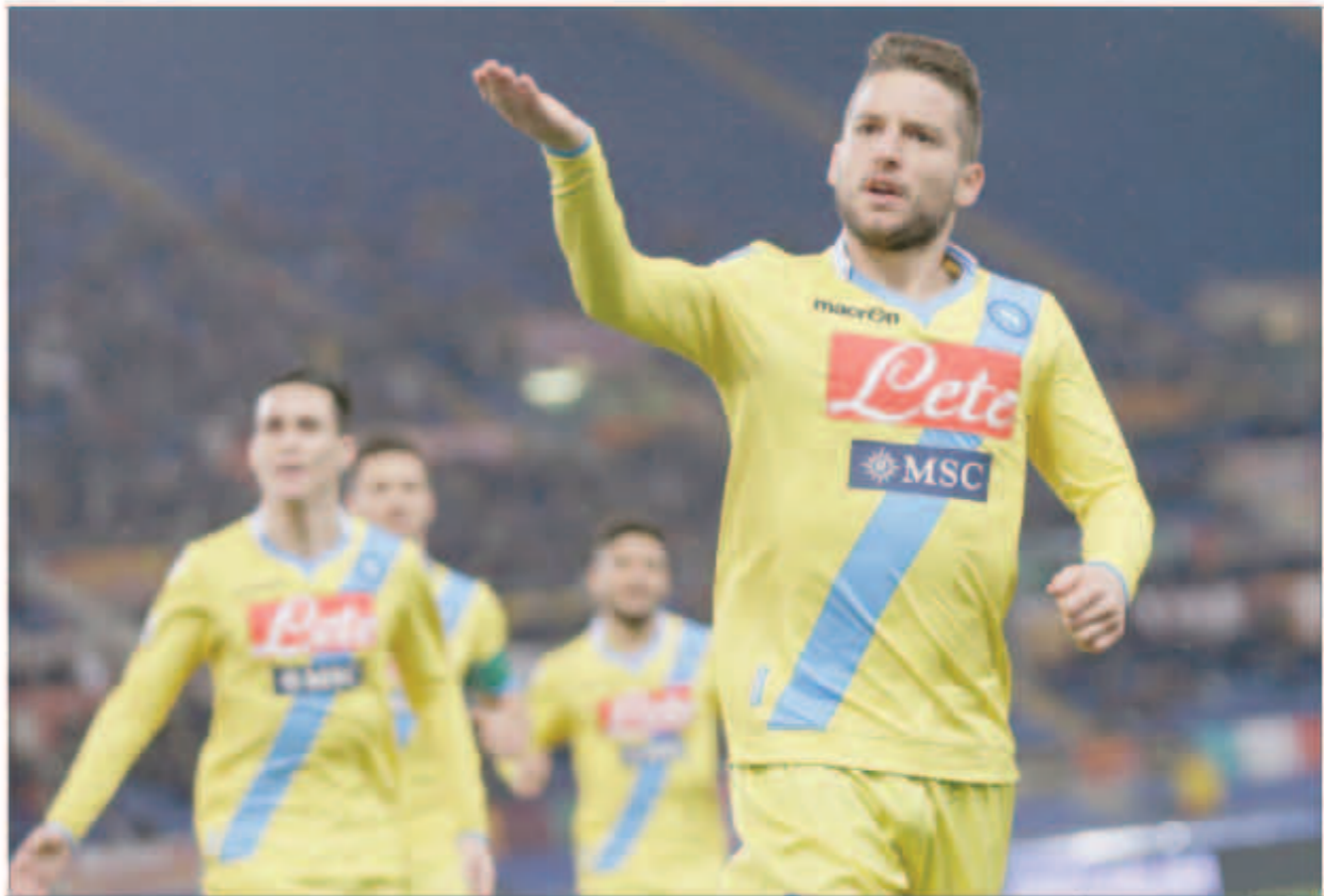
نابولي يبحث عن التأهل رغم صعوبة المهمة

يسعى نادي العاصمة الإيطالية روما لاستغلال التقدم البسيط الذي حققه على أرضه أمام منافسه نابولي عندما يحل ضيفا عليه في إياب الدور قبل النهائي من مسابقة كأس إيطاليا لكرة القدم.