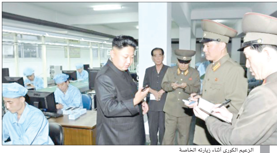
الزعيم الكوري أثناء زيارته الخاصة

هونغ كونغ، الصين - «CNN»: بدأت كوريا الشمالية بصناعة هواتفها الذكية، وذلك رغم أن قدرة وصول السكان إلى الإنترنت وشبكة الهاتف، تعتبر أمراً محدوداً.