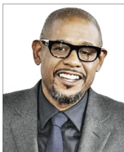
فورست ويتكر بطل «كبير الخدم»

لوس انجليس - «رويترز»- تصدر فيلم «كبير الخدم» Lee Daniels The Butler إيرادات السينما في الولايات المتحدة وكندا للاسبوع الثاني على التوالي متقدما على الفيلم الكوميدي «نحن عائلة ميلر» Were the Millers لجيفر انيستون وفيلم جديد من سلسلة افلام الخيال العلمي والحركة. واشارت تقديرات شركات التوزيع السينمائي التي ان إيرادات فيلم «كبير الخدم» بلغت 17 مليون دولار من عائدات مبيعات التذاكر في دور العرض منذ يوم الجمعة وحتى يوم الأحد. وهو من اخرج لي دانيلز وبطولة كل من فورست ويتكر واوبرا وينفري وجون كوزاك.