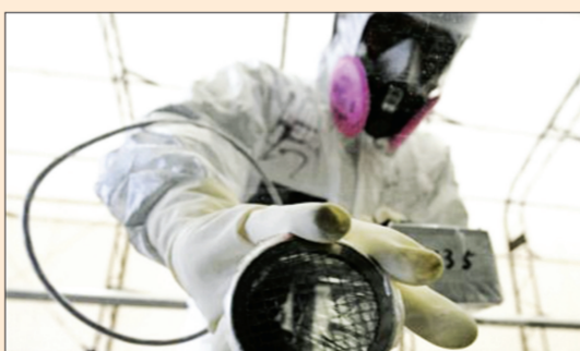
عامل يجري مسحاً لتحديد مستويات الإشعاع لحزمة فوكوشيما

طوكيو - «رويترز»: قالت هيئة الرقابة النووية في اليابان أمس انها رفعت رسميا تصنيف الخطورة لحدث تسرب للمياه المشعة في محطة فوكوشيما النووية إلى المستوى الثالث وفقا لمقياس دولي للتسرب الإشعاعي. ويرفع تحديث التصنيف الذي قامت به هيئة الرقابة النووية اول انذار لليابان وفق المقياس الدولي للتسرب الإشعاعي منذ انحصار قضبان القود في ثلاثة مفاعلات نووية في فوكوشيما في مارس 2011 بعد ان دمر زلزال وأموج مد بحري عاتية المحطة.