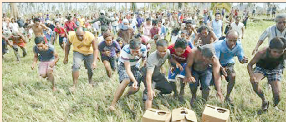
جوعى يهرعون نحو مساعدات الإغاثة

وكالات الإغاثة الدولية لآزمة إنسانية ضخمة حيث أدت الكارثة لتشيريد نحو أربعة ملايين ارتفاعا من 900 ألف في أواخر الأسبوع الماضي. وزار الرئيس بنينو اكينو - الذي ماله حجم الكارثة فيما تعرض لانتقادات بسبب عشوائية رد الفعل في بعض الأحيان - المناطق المنكوبة يوم الأحد ولم تكن هذه المرة الأولى التي يعقد فيها إلى القاء اللوم على السلطات المحلية بدعوى التقصير في معالجة الأزمة على حد قوله.