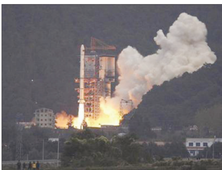
صاروخ ينطلق من منصة في الصين

بيكين - «رويترز»: قال مسؤول صيني زمس ان الصين سترسل أول مجس إلى سطح القمر أوائل الشهر المقبل وان المركبة الاستكشافية ستهب لجمع معلومات عن سطحه في خطوة مهمة لتحقيق طموحات البلاد الفضائية.