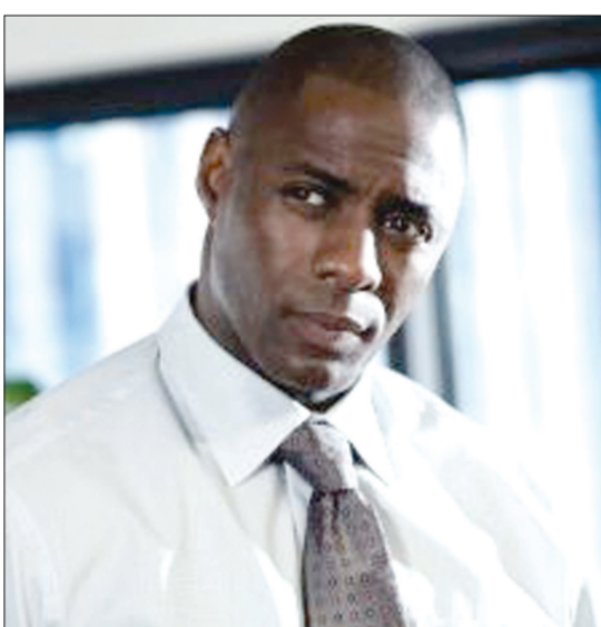
الممثل إدريس إلبا

لوس انجليس - «رويتز»: قد لا يكون الممثل البريطاني إدريس إلبا يشبه الزعيم الجنوب إفريقي نلسون مانديلا في ملامحه إلا أنه توصل إلى أن حضوره القوي سيقطع شوطاً طويلاً في تجسيده لشخصية السماسي المخضرم. يجسد إلبا شخصية الزعيم المناهض للفصل العنصري والرئيس الأسبق لجنوب إفريقيا في فيلم «مانديلا: مسيرة طويلة إلى الحرية» (Mandela: Long Walk to Freedom) وتعين على إلبا دراسة ماضي السياسي المخضرم مانديلا الذي يعرفه الجميع عندما كان محامياً شاباً ألهم كثيرين للانضمام إلى الكفاح ضد حكم البيض في جنوب إفريقيا. وقال إلبا «41 عاماً» ما حفز الناس عندما راوه كشاب كان حضوره فقد كان له حضور قيادي حقاً... كنت تريد أن تتبعه إذا قال «دعونا ننتقل».