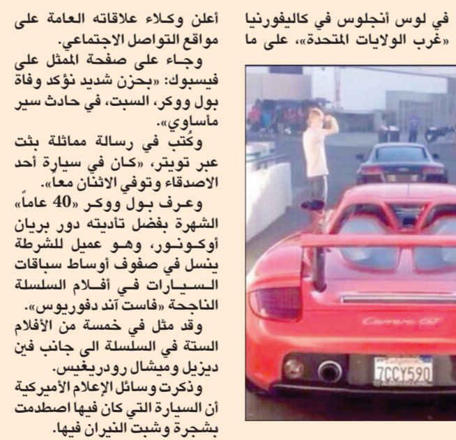
آخر صورة لبول ووكر قبل وبعد الحادث الذي أدى بحياته

لوس أنجلوس - «وكالات»: أفلام الحركة «فاست أند فوريوس» توفي بول ووكر أحد أبطال سلسلة