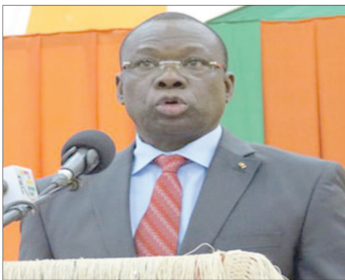
رئيس وزراء بوركينافاسو لوك أدولف تياو

واغادوغو - «وكالات»: فتح محتال صفحة على فيسبوك باسم رئيس وزراء بوركينافاسو لوك أدولف تياو، بهدف «الاحتفال على رواد الإنترنت»، على ما أفاد مصدر رسمي في واغادوغو.