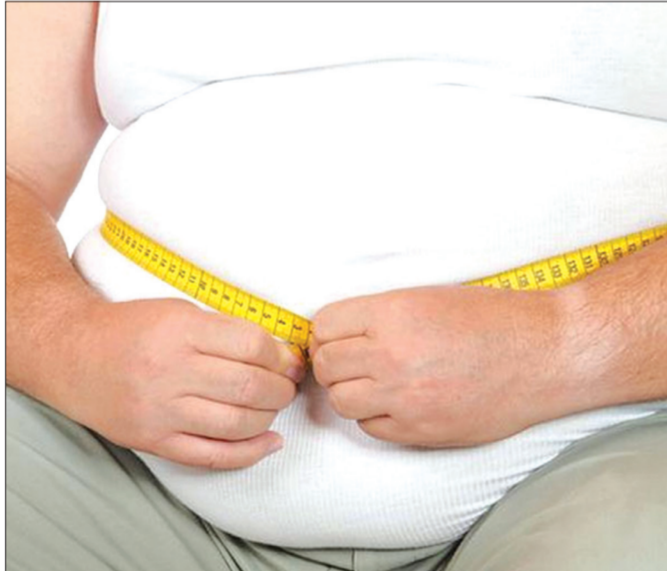
السمنة تهدد للصحة وعبء على الميزانية

خلصت دراسة جديدة إلى أن سائقي الشاحنات وعمال النظافة والتقنيين هم من بين فئات العمال الأكثر سمنة. وذكر موقع لايف ساينس الأمريكي أن الدراسة التي أجرتها وزارة العمل الأمريكية، وجدت أن من بين الفئات الأكثر سمنة سائقي الشاحنات وعمال النظافة والتقنيين، يليهم العاملون في مجال الخدمات الصحية، والإدارة ورجال الدين. وشملت الدراسة فقط ولاية واشنطن، وقال أحد المسؤولين عنها إن المقياس الذي استخدم لتحديد السمنة يمكن أن يكون غير دقيق عند تطبيقه على الأشخاص الذين لديهم عضلات كبيرة من بينهم العاملون في مكافحة الحرائق وعمال البناء، وظهر على سبيل المثال أن العاملين في مجال البيع والدعم التقني، أكثر وزناً من الأطباء والمحامين. وقال الباحث المسؤول عن الدراسة ديفد بونوتو إن الأشخاص يمضون قرابة ثلث أو حتى نصف ساعات الاستيقاظ في مكان العمل، مضيفاً أن بيانات العمل غير متشابهة. وحلل الباحثون نتائج استطلاع سنوي بين العاميين 2003 و2009 بشأن عادات الأكل، والنشاط البدني الروتيني، ومؤشر كتلة الجسم، وطلب من 38 ألف موظف -في عمر بين 18 و64 عاماً- تحديد وظيفتهم ومكان عملهم. ووجد ربيع هؤلاء مصابين بالسمنة، وأكثر الحالات كانت بين الأكبر سناً والذكور والأقل تعليماً، والأقل مدخولاً والعاملين في المجالات التي لا تتطلب جهداً بدنياً.