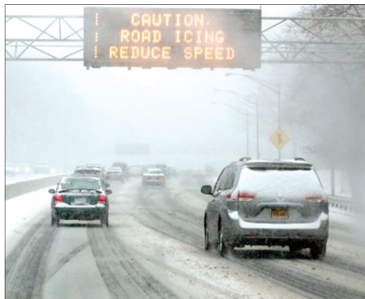
تساقط ثوج غزيرة مع انخفاض في درجات الحرارة إلى ما دون معدلاتها شمال شرق الولايات المتحدة

واشنطن - «وكالات» - تعرضت مناطق شمال شرق الولايات المتحدة لتساقط طوج غزيرة مع انخفاض في درجات الحرارة إلى ما دون معدلاتها أمس الأول تحت تأثير عاصفة قوية أدت إلى إلغاء آلاف الرحلات الجوية وتسببت بفضوى في حركة المرور. ويحتاج الطقس السيئ برياحه الشديدة البرودة وتلوجه الغزيرة المناطق الممتدة من واشنطن إلى نيو انغلاند، إضافة إلى مناطق الوسط الغربي. وكتبت «شيكاغو تريبيون»، أنه مع الأخذ بالاعتبار عامل الريح فإن الحرارة في شيكاغو انخفضت إلى أقل من 28 درجة مئوية تحت الصفر. وبدأ وسط واشنطن هادئاً بعد أن قررت الحكومة الفيدرالية إغلاق إدارتها الرسمية، وطلبت من الموظفين البقاء في منازلهم الثلاثة. كما ستفتح الوكالات الفيدرالية، الأربعاء، أبوابها بتأخير ساعتين، ويمكن للموظفين أيضاً أخذ إجازات، وستبقى معظم المدارس في العاصمة وولاية ميريلاند وفرجينيا المجاورتين مغلقة الأربعاء. وسجلت إدارة مترو واشنطن الثلاثاء نصف عدد الركاب الذين عادة ما يستخدمون المترو في أيام الأسبوع.