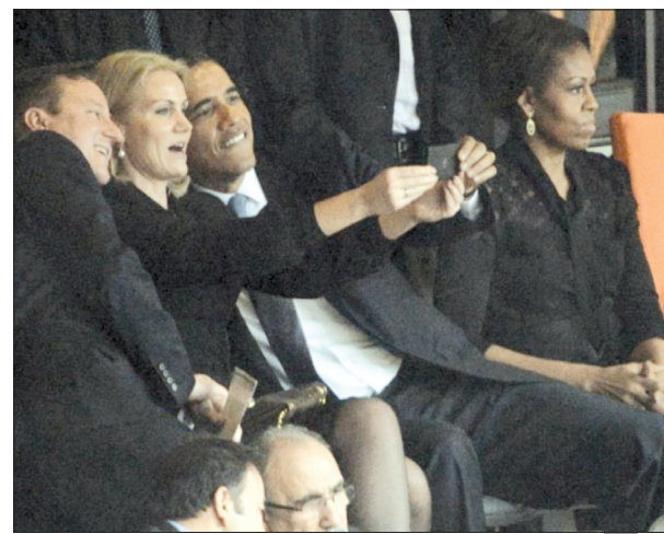
أوباما وكامبيرون ورئيسة وزراء الدنمارك وميشيل الغاضبة

موسكو - «وكالات» - آخر صراعات رئيس الحزب الليبرالي الديمقراطي الروسي، فلاديمير جرينوفسكي، صاحب التصريحات «الشهيرة»، مطالبته للرئيس الأمريكي الانفصال عن زوجته. فحزب رئيس الحزب الليبرالي الديمقراطي، أحد الأحزاب الأربعة الممثلة في البرلمان الروسي زوجة الرئيس الأمريكي باراك أوباما المسؤولة عن تدهور مظهره، ويناشد باراك الانفصال من ميشيل. وتعود جرينوفسكي على مدى سنين إطلاق تصريحات ناروية حول كثير من القضايا، لعل واحدة منها دعوته لبناء سور من الأسلاك الشائكة حول القوقاز لمواجهة الإرهاب. كما أنه كان دعا انتصاره في نهاية العام 2013 إلى «الأيديخو» ولا يتعاطوا الكحول، واليوم سوف نعرض عليهم المطبخ النباتي، ويؤكد جرينوفسكي أنه امتنع عن أكل اللحوم منذ الصيف الماضي لأن اللحم برأيه «مادة غذائية مضرّة جداً». ونقلت وسائل الإعلام الروسية أن فلاديمير جرينوفسكي، عبر عن اعتقاده بأن من يصبح رئيساً للدولة الكبرى يجب أن يطلق زوجته لأنها تمنعه من إدارة شؤون البلاد. وحمل جرينوفسكي زوجة باراك أوباما مسؤولية تدهور مظهره، والذي يدل عليه «أخضرار جلده وتكافر التجاعيد في راسه».