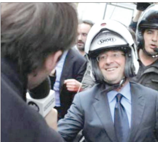
خوذة «العاشق» هولاند وجدت رواجاً في فرنسا

باريس - «العربية نت»: بمجرد ظهور الرئيس الفرنسي مرتديا خوذة دراجته النارية مع صديقه الممثلة السينمائية جولي غاييه، حتى أصبح العطور على ماركة «داكستر» التي كان يرتديها الرئيس والتي سميتها الشركة المصنعة بالخوذة الرئاسية، أمرا مستحيا حيث قامت الشركة بطرح جميع ما في مخازنها للبيع وتم بيع أكثر من ألف خوذة خلال يوم واحد على سبيل المثال. وتمثل الألف خوذة التي تم بيعها زيادة بنسبة عشرة أضعاف في المبيعات. مما دفع الشركة لإعادة تسمية الخوذة باسم «دا ديكستر بريزيدنت»، أي الخوذة الرئاسية وإصدار إعلان ساخر يشكر فيه الرئيس الفرنسي هولاند.