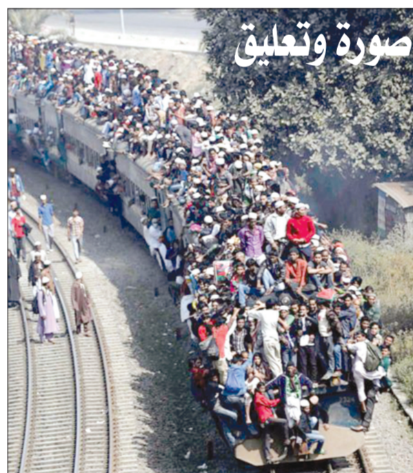
صعود مئات فوق سطح القطار في بنغلاديش وسط أزمة مواصلات خانقة تعاني منها البلاد

لندن - العربية.نت - يوم الثلاثاء الماضي ألقى الرئيس الأمريكي باراك أوباما خطاباً طويلاً عن "حالة الاتحاد" كالعادة سنوياً في بلاد أكبر دولة بالعالم، وفيه تطرق لقضايا داخلية وإقليمية عالمية ساخنة، لكنه نسي "الاتحاد" الأهم والأكثر سخونة، وهو حالته مع شريكة حياته، فأحدث التقارير عنه وعنهما تشير إلى الأسوأ. شيطان التفاصيل يختصرها بأن خلافات حقيقية نشأت منذ صيف العام الماضي بينه وبين زوجته ميشيل روبنسون، التي تصغره بثلاثة أعوام، وبدأ صداها يعبر أسوار البيت الأبيض، وعنوانها 5 كلمات: غيرة وقلّة احترام وتراجع واضح بالانسجام. هذا، وغيره، تطرقت إليه صحيفة "ناشونال إنكويرر" الأمريكية، الشعبية الطراز والمعروفة