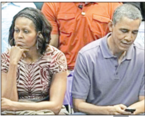
اتحاد أوباما وميشيل مهذب بالتمسح

لندن - العربية.نت - يوم الثلاثاء الماضي ألقى الرئيس الأمريكي باراك أوباما خطاباً طويلاً عن "حالة الاتحاد" كالعادة سنوياً في بلاد أكبر دولة بالعالم، وفيه تطرق لقضايا داخلية وإقليمية عالمية ساخنة، لكنه نسي "الاتحاد" الأهم والأكثر سخونة، وهو حالته مع شريكة حياته، فأحدث التقارير عنه وعنهما تشير إلى الأسوأ. شيطان التفاصيل يختصرها بأن خلافات حقيقية نشأت منذ صيف العام الماضي بينه وبين زوجته ميشيل روبنسون، التي تصغره بثلاثة أعوام، وبدأ صداها يعبر أسوار البيت الأبيض، وعنوانها 5 كلمات: غيرة وقلّة احترام وتراجع واضح بالانسجام. هذا، وغيره، تطرقت إليه صحيفة "ناشونال إنكويرر" الأمريكية، الشعبية الطراز والمعروفة