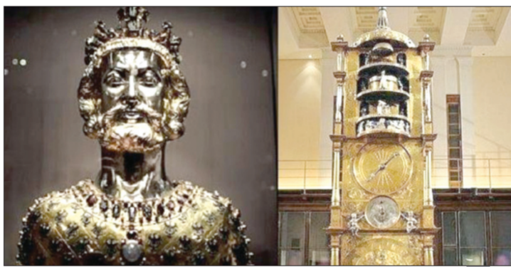
ساعة الرشيد كما أعادوا إنتاجها وتمثال شارلمان الذهبي

ما راجعته «العربية.نت» في أرشيفات عظام «مؤسس أوروبا» بين غيرها . الكاتدرائية، المعروفة بكاتدرائية الإمبراطور، هي رومانية كاثوليكية، شاركما في العام 814 وضعوا رفاته في قبو أسفلها.