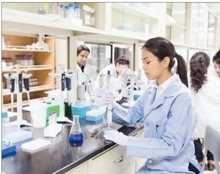
دراسة حديثة تحمل أملا جديدة لمرضى السكري

«العربية نت» - اكتشف العلماء علاجاً جديداً لمرض السكري، وذلك بتحويل خلايا الجلد إلى خلايا بنكرياسية منتجة للإنسولين، وطور العلماء خلايا ليفية أخذت من الفئران مستخدمين تقنية دقيقة وحديثة، وفقا لدراسة نشرت في صحيفة «ديلي ميل» البريطانية. وأجريت الدراسة على حوالي 300 شخص في بريطانيا مصاب بداء السكري، والذي يعتبر من أكثر الأمراض انتشاراً. ويقول البروفيسور، شينغ دينغ، من معهد الغلاستون ومن جامعة كاليفورنيا في سان فرانسيسكو: «إن نقطة القوة في هذا العلاج أنه يوفر مصدراً غير محدود من خلايا بيتا المنتجة للأنسولين الوظيفية، والتي يمكن بعد ذلك زرعها في المريض».