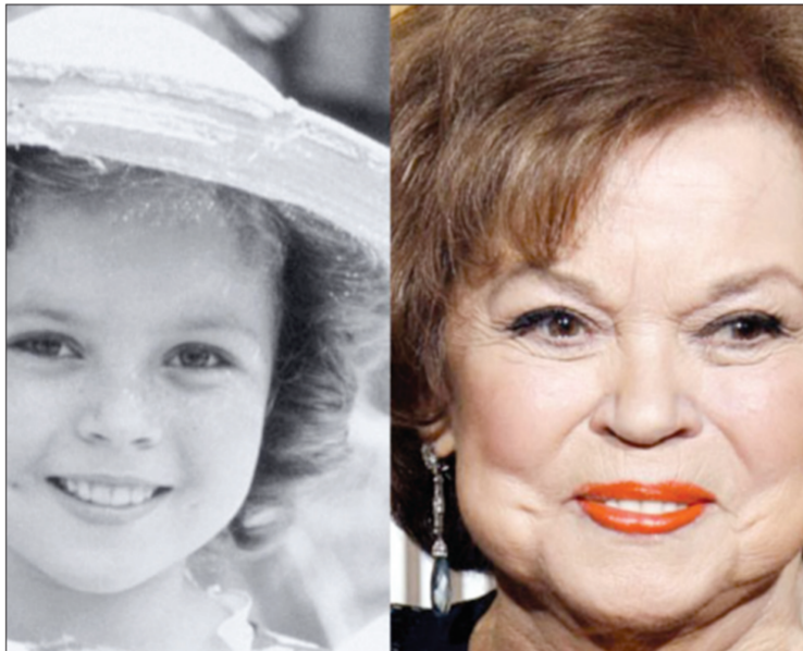
شيرلي تمبل .. بين عهدين متباعدين

لوس أنجلوس - «وكالات» - توفيت طفلة هوليوود الأشهر، معشوقة أمريكا الصغيرة التي لطالما رسمت البسمة على وجوه رواد السينما في حقبة الكساد، وسليت قلوب الأميركيين بوجهها البريء الباسم، وشعرها المتوجج، والنمش الذي كان يملأ وجنتيها. رحلت شيرلي تمبل عن عمر ناهز الخامسة والثمانين عاما. فقد أعلن المتحدث الرسمي باسم نجمة هوليوود عن وفاتها لأسباب طبيعية بفعل الشيخوخة، محترقة، هذه المميزات مجتمعة جعلتها واحدة من أكثر النجوم شعبية في شبك التذاكر الأمريكي لأربعة أعوام متتالية، منذ العام 1935 - وكانت لا تزال في السادسة من عمرها - ولغاية العام 1938، حيث يعود لها الفضل في نقاش شركة 20th Century Fox من الإفلاس بأفلام مثلا، كيرلي توب Top، والتمردة الصغيرة «The Littlest Rebel». يذكر أن شيرلي تمبل نالت أول جائزة أوسكار وهي في السادسة من عمرها، ولا تزال تحتفظ بهذا الرقم القياسي كأصغر ممثلة تحصل على الأوسكار. وعندما بلغت الحادية والعشرين من عمرها قررت التماثل وتحوّلت إلى ناشطة سياسية، ثم مرشحة للكونغرس عن حزب الجمهوريين، وتقلدت عدة مراكز دبلوماسية، بضمنها منصب سفيرة الولايات المتحدة الأمريكية في تشيكوسلوفاكيا في أواخر الثمانينات.