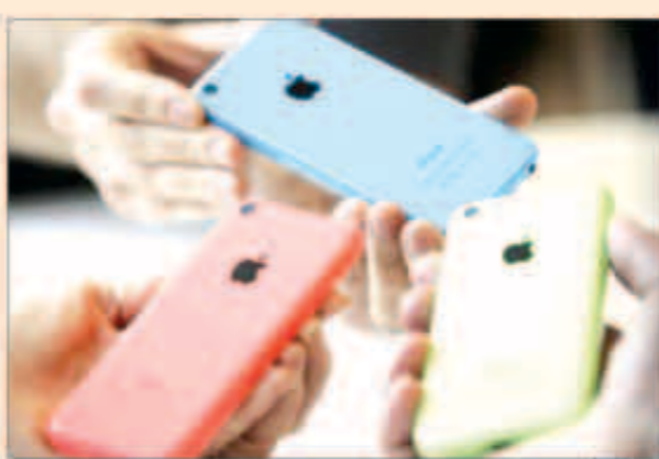
زارع يمايون أي فون سي خلال حفلة شركة أبل

وقال المصدر إن مستوى المعروض الذي وعدت أبل المتاحته من الهاتفين في أول أيام البيع والأسبوع التالي محيط جداً مضيقاً أن عدد الهواتف المخصصة لجميع الشركات محدود على ما يبدو. واستطرد المصدر الذي رفض الكشف عن هويته لأن أبل لم تكشف عن عدد الطلبات المسبقة لأي من الهاتفين أن الطلبات المسبقة «ليست هائلة» أيضاً. ويبدأ سعر الطراز الأعلى 5 أس من 199 دولاراً من خلال التعاقد مع شركة اتصالات وتطرحه الشركة بالألوان الرمادي والفضي والذهبي. وتباع الهواتف من خلال أربع شركات اتصالات هي آي.تي. أند تي. وفرايزون وسبرينت وتي موبايل. وأحجم ممثلو الشركات الثلاث عن التعليق ولم يتسن الاتصال بأبل للتعليق. شرح الصورة: