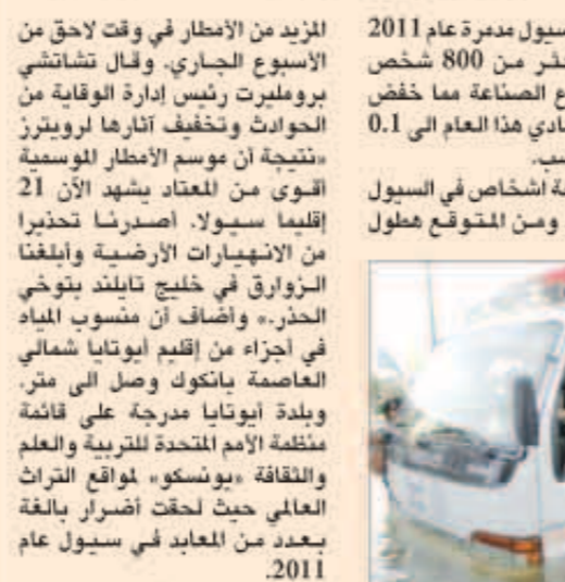
السيول غمرت ريع أقاليم تايلاند

باتوك - «رويترز»: تآثر أكثر من 600 ألف تايلندي بالسيول منذ يوليو وغمرت المياه أكثر من ربع أقاليم تايلاند مما دفع المسؤولين إلى إصدار تحذيرات من انهيارات أرضية وبدء إجراءات للإجلاء يوم الإثنين. وأسفرت سيول مدمرة عام 2011 عن مقتل أكثر من 800 شخص وعطلت قطاع الصناعة مما خفض النمو الاقتصادي هذا العام إلى 0.1 في المئة وحسب. وقتل أربعة أشخاص في السيول هذا العام. ومن المتوقع حصول إقليم سيولا. أصدرنا تحذيراً من الانهيارات الأرضية وبلغنا الزوارق في خليج تايلاند بتوخي الحذر. وأضاف أن منسوب المياه في أجزاء من إقليم ايوتايا شمالي العاصمة بانكوك وصل إلى متر. وبلد ايوتايا مدرجة على قائمة منظمة الأمم المتحدة للتربية والعلم والثقافة «يونسكو» مواقع التراث العالمي حيث لحقت أضرار بالغة بعدد من المعابد في سيول عام 2011.