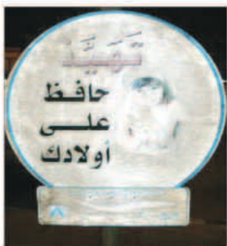
من حملة الموروث اللغوي

الدوحة - «كونا»: يلمس مواطنو دول مجلس التعاون الخليجي الزائرون لدولة قطر عناية ملحوظة بالموروث اللغوي القطري الذي يعد امتداداً للموروث الخليجي حيث التشابه الكبير بين معظم المصطلحات والتسميات المستخدمة في الحياة العامة في قطر والمفردات الخليجية الشعبية. ويعمل القطريون على استخدام المفردات الشعبية والتراثية وتوظيفها في الحياة العامة على احياء الموروث اللغوي الخليجي والمحافظة عليه ونقله الى ابناء الجيل الجديد وصيانتته من الانتثار في ظل انتشار وسائل المدينة الحديثة التي قد تؤثر تأثيراً سلبياً على الموروث اللغوي. وقال الكاتب والباحث في التراث