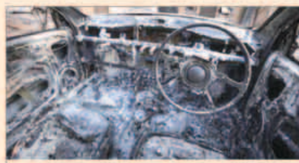
أثار الحمار والحرائق

سيدني - «رويترز»: اجتهد رجال الإطفاء في أستراليا امس الثلاثاء لإحتواء حرائق غابات ضخمة تستعر في المناطق الجبلية غربي سيدني وتخشى السلطات خسارة المزيد من الأرواح والمنازل مع توقعات بهبوب رياح قوية وطقس شديد الحرارة.