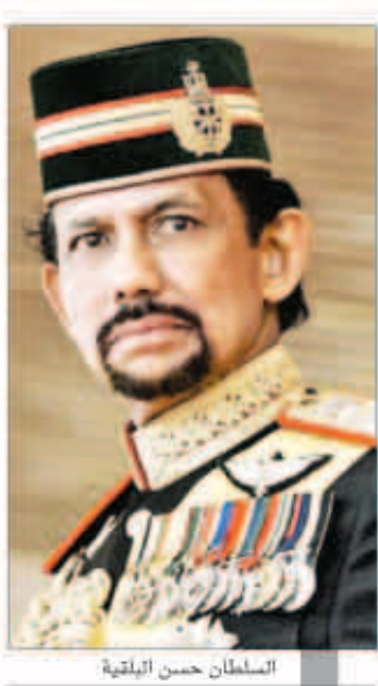
السلطان حسن البلقية

أقرت سلطنة بروناي الصغيرة في جزيرة بورنيو امس تطبيق الشريعة الإسلامية في البلاد، وأعلن السلطان حسن البلقية احد الثرى الناس في العالم في خطاب رسمي المصادقة على قانون جنائي اسلامي جديد سيدخل حيز التطبيق تدريجيا خلال ستة اشهر المقبلة.