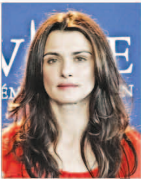
الممثلة رايتشل ادامز

«د. ب. أ» ذكرت تقارير إخبارية أن الممثلة رايتشل ماك أدامز تتفاوض حاليا للانضمام إلى طاقم عمل فيلم الخيال العلمي الجديد «باسجرز» أو «ركاب» الذي يقوم ببطلته النجم كيانو ريفز. وأقادت مجلة «فارييتي» المعنية بأخبار السينما والمشاهير، أن الفيلم تجري أحداثه في المستقبل داخل إحدى المركبات الفضائية التي تنقل الآلاف من الركاب إلى كوكب جديد، حيث يستيقظ أحد الركاب «ريفز» من نوم بالتجميد قبل 90 عاما من أي شخص آخر ثم يوقظ امرأة جميلة من المقرر أن تجسد شخصيتها ماك أدامز.