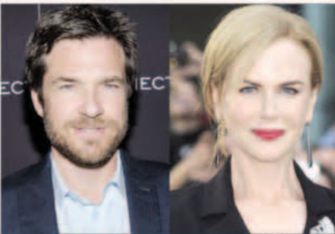
نيكول كيدمان وجيسون

«د ب أ»: انضمت الممثلة نيكول كيدمان إلى طاقم عمل فيلم «ذا فاميلي فانتج»، «أسرة فانتج» الذي سينتج وإخراجه ويشترك في بطولته جيسون بيتمان. يحكي الفيلم قصة حياة زوجين من فنانتي الأداء جيران ابنتهما وابتنتهما دائما على المشاركة في أعمال غريبة. وعندما يكبر الابن والابنة ويعودان إلى المنزل وهما في حالة متازمة يضطران للانحراط مع والديهما في تنفيذ أداء أخير جريء يعتبره والدان «أداء العمر». كتب سيناريو الفيلم ديفيد لينزي أبير الحاصل على جائزة بوليتزر، واستوحاه من رواية «حفرة الأرنب» للكاتب كيفن ويلسون. ومن المقرر إنتاج الفيلم في عام 2014.