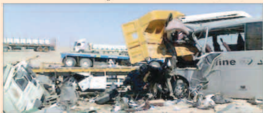
حادثة التصادم بين الحافلة والشاحنة

في جنوب أفريقيا التي تعد أكبر اقتصاد في أفريقيا وسنت الحكومة قوانين صارمة لتضييق الحقائق على القيادة المتهوررة والحافلات سيئة الصيانة حيث تحاول تكليل العدد السنوي للقتلى وهو 14 ألف قتل. وقتل ما لا يقل عن 22 شخصاً في مارس آذار عندما اصطدمت حافلة ذات طابقين بسفح جبل. وكانت الحافلة تسير على طريق نهر هيكس الخطير على بعد 140 كيلومتراً شمال شرقي كيب تاون.