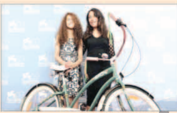
مشهد من الفيلم السعودي «وجدة»

وأضاف «أنه تم اعتماد اللجنة التي كونتها الجمعية من عدد من المختصين السعوديين في السينما والدراما والموسيقى والأزياء، لتصبح الجهة الرسمية المرشحة من قبل أكاديمية العلوم والفنون الأمريكية القائمة على سياق الأوسكار في لوس أنجلوس».