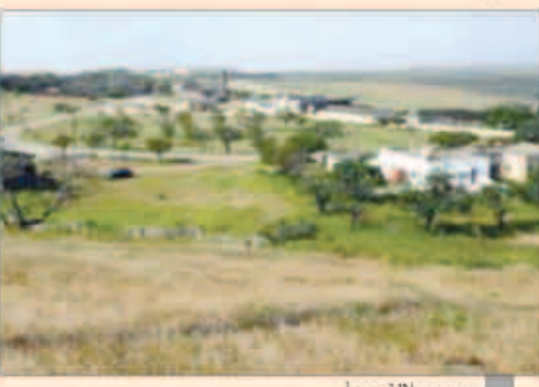
ربيع صلاة... بدأ

من المدن العمانية لمشاهدة جمال الطبيعة في هذا الفصل والتقاط صور فوتوغرافية. وبفضي كثير من السكان لبالبحر بالمبيت في احضان تلك الجمال للاستمتاع بالليالي المفعرة والروائح العطرة التي تنبعث ليلاً من الاشجار والنباتات. وتسود اهمية فصل الربيع لدى الفلاحين والصيادين ومربي الماشية على السواء فهو موسم لتكاثر الزراعات المختلفة ونوافر مختلف انواع الاسماك وانتشار المراعي الخضراء وجنى العسل. وتزاح خلال هذا الفصل سنائر الضباب الابيض الخفيف عن الطبيعة التي رسمتها اقطار الخريف في السهل والجبل والهضاب الواسعة المستوى لتشكل حدائق طبيعية متعددة. ويمثل فصل الربيع لسكان الجبال وروعاة ومربي الماشية موسماً للخير فيه يكثر العشب وتنتشر المراعي وتنقل الماشية في السهول والجبال دون عناء البحث عن المرعى لتتوزع النباتات خلال هذا الفصل الذي تتميز فيه اللحوم والحليب ومشتقاته بجودة طعمها.