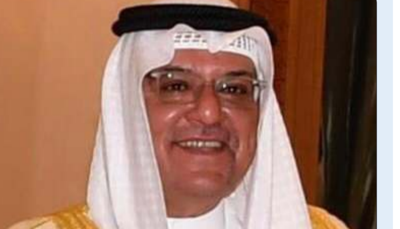
الشيخ حمد الحمود

هنا محافظ الأحمدى الشيخ حمد سالم الحمود، رئيس مجلس الوزراء الشيخ أحمد عبدالله بصدر الأمر الأميري بتعيينه رئيسا لمجلس الوزراء وتكليفه بترشيح أعضاء الحكومة الجديدة.