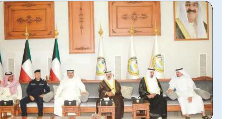
حمد الحبشي خلال استقبال المهنيين

استقبل محافظ الجبراء حمد الحبشي المهنيين بمناسبة تسلمه مهام منصبه، وذلك في قاعة الاحتفالات بمحافظة الجبراء.