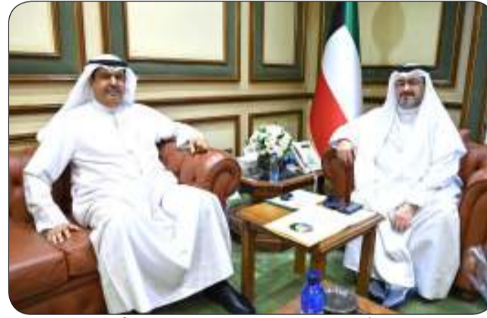
الشيخ عبدالله العلي مستقبلا الأصفر

محافظ العاصمة العميد سليمان الجراح يرافقه مساعده العميد طلال عبيد، والعقيد عبد العزيز حمزة.