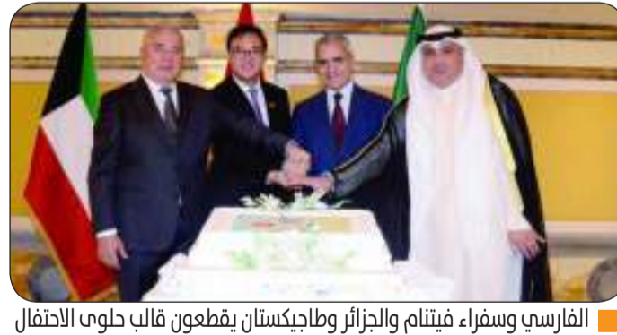
الفارسي وسفراء فيتنام، والجزائر وطاجيكستان يقطعون قالب لحوي الأنتفال

سيفقد شقيقاً عزيزاً، حيث كان واحداً من أكثر السفراء نشاطاً، ويجب أن نفتخر به بلاده، ونجاحه يأتي في المرتبة الأولى بسبب وجود زوجته إلى جانبه، مشدداً على أن سفير فيتنام، كان وسبقاً صديقا للجميع.