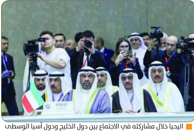
اليعيا خلال مشاركته في الاجتماع بين دول الخليج ودول آسيا الوسطى

وذكرت وزارة الخارجية في بيان، أنه جرى خلال اللقاء استعراض محمل العلاقات الثنائية الوثيقة التي تربط البلدين، وسبل تطويرها وتنميتها في مختلف المجالات، وتعزيزها إلى مستوى الشراكة، بالإضافة إلى مناقشة عدد من القضايا محل الاهتمام المشترك.