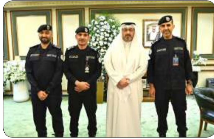
ومستقبلا الجراح وعبيد وحزمة

وجرى خلال المقابلة مناقشة عدد من القضايا الأمنية المختلفة التي تتعلق بجميع مناطق المحافظة. انتهى