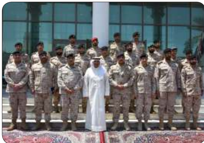
■ وفي لقطة جماعية مع كبار القادة

أكد الأمين العام لمجلس التعاون لدول الخليج العربية جاسم البيديوي ضرورة الاستمرار في دفع مسيرة العمل الخليجي المشترك وتسخير كافة القدرات السياسية والاقتصادية والعسكرية لمواجهة مختلف التحديات. جاء ذلك في تصريح للبيديوي نقله بيان صحفي