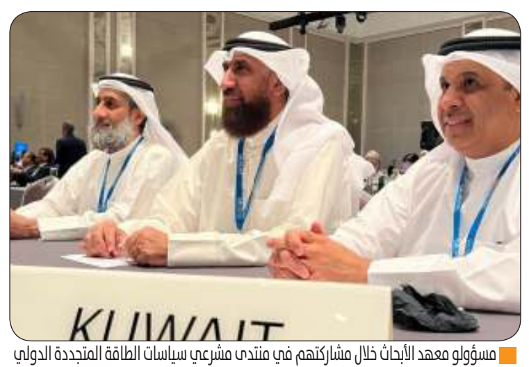
■ مسؤولو معهد الأبحاث خلال مشاركتهم في منتدى شرعي لسياسات الطاقة المتجددة الدولي

أبوظبيي - "كونا": أعلنت دولة الكويت أمس الأول تحديث أهدافها للطاقة المتجددة وتعزيز استراتيجيات كفاءة الطاقة مؤكدة دورها البارز في الانتقال العالمي نحو مستقبل خال من الكربون وذلك في إطار التزامها المستمر بالاستدامة والطاقة المتجددة. جاء ذلك في كلمة القاها المدير العام لمعهد الكويت للأبحاث العلمية الدكتور مشعان العتيبي خلال ترؤسه وفد دولة الكويت المشارك في منتدى شرعي لسياسات الطاقة المتجددة الدولي الـ 14 الذي تنظمه الوكالة الدولية للطاقة المتجددة "إيرينا" في أبوظبي تحت عنوان "البنات الأساسية لمستقبل متجدد". تسريع التقدم نحو مضاعفة مصادر الطاقة