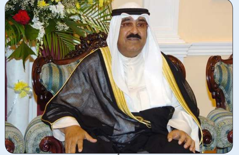
■ سمو أمير البلاد

بعث سمو أمير البلاد الشيخ مشعل الأحمد ببرقية تهنئة إلى الرئيس إيمرسون ممانغاوا رئيس جمهورية زيمبابوي الصديقة عبر فيها سموه عن خالص تهانئه بمناسبة العيد الوطني لبلاده، متمنيا سموه له موفق الصحة والعافية ولجمهورية زيمبابوي وشعبها الصديق كل التقدم والازدهار. وبعث سمو الشيخ الدكتور محمد الصباح رئيس مجلس الوزراء المكلف بتصريف العاجل من الأمور ببرقية تهنئة مماثلة.