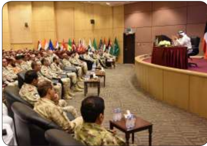
■ جانب من المحاضرة