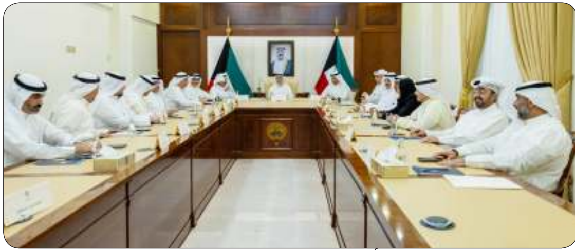
■ نائب وزير الخارجية يترأس اجتماعا لمجلس السلكين الدبلوماسي والقنصلي

ترأس نائب وزير الخارجية السفير الشيخ جراح الجابر أمس الخميس اجتماع مجلس السلكين الدبلوماسي والقنصلي في ديوان عام وزارة الخارجية. وشارك في الاجتماع مساعد وزير الخارجية أعضاء المجلس حيث تم خلاله بحث الموضوعات الواردة على جدول الأعمال.