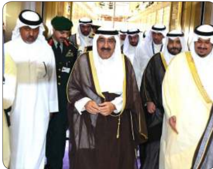
سمو الأمير لدى وصوله إلى السعودية لترؤس وفد الكويت في المنتدى