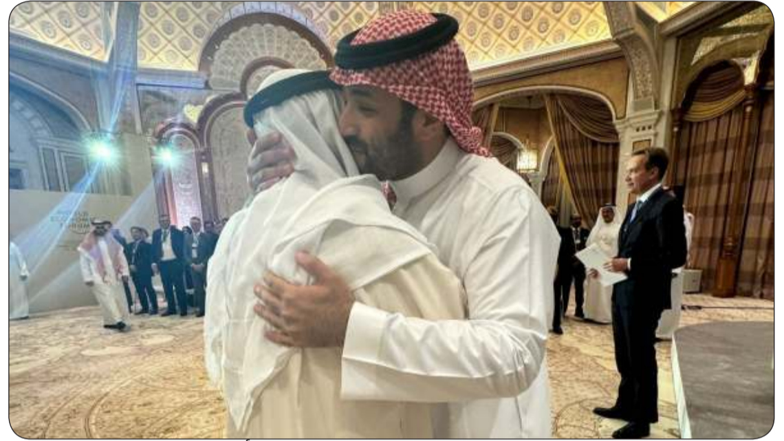
سمو الأمير محمد بن سلمان معانقا سمو أمير البلاد

الكويت لدى المملكة العربية السعودية الشقيقة الشيخ صباح الناصر وأعضاء السفارة...رافقت سموه السلامة في الحل والترحال.