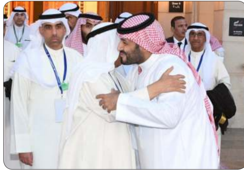
سمو الأمير يحمل الأمير محمد تحياته لخادم الحرمين الشريفين

بمقدار 2.9 درجة مئوية وفوارق كبيرة في إمكانية الوصول إلى مصادر الطاقة. وكان صاحب السمو والوفد الرسمي المرافق لسموه وصل عصر أمس مطار الملك خالد الدولي في المملكة العربية السعودية الشقيقة، إذ كان في استقبال سموه على أرض المطار صاحب السمو الملكي الأمير محمد بن عبدالرحمن بن عبدالعزيز آل سعود نائب أمير منطقة الرياض والأمين العام لمجلس التعاون لدول الخليج العربية جاسم البديوي وسفير