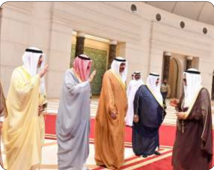
أمير البلاد لدى مغادرته أرض الوطن إلى السعودية

جسدت عمق العلاقات الأخوية الوطيدة بين البلدين والشعبين الصديقين وسبل دعمها وتعزيزها وتطويرها بما يخدم مصالحهما المشتركة والتأكيد على دفعها نحو آفاق أرحب وتوسيع أطر التعاون بين البلدين الشقيقين وتعزيز التكامل الراسخ والوثيق بينهما في شتى المجالات وعلى كافة الأصعدة كما تم خلال اللقاء مناقشة القضايا ذات الاهتمام المشترك وأبرز المستجدات على الساحتين الإقليمية والدولية. حضر اللقاء أعضاء