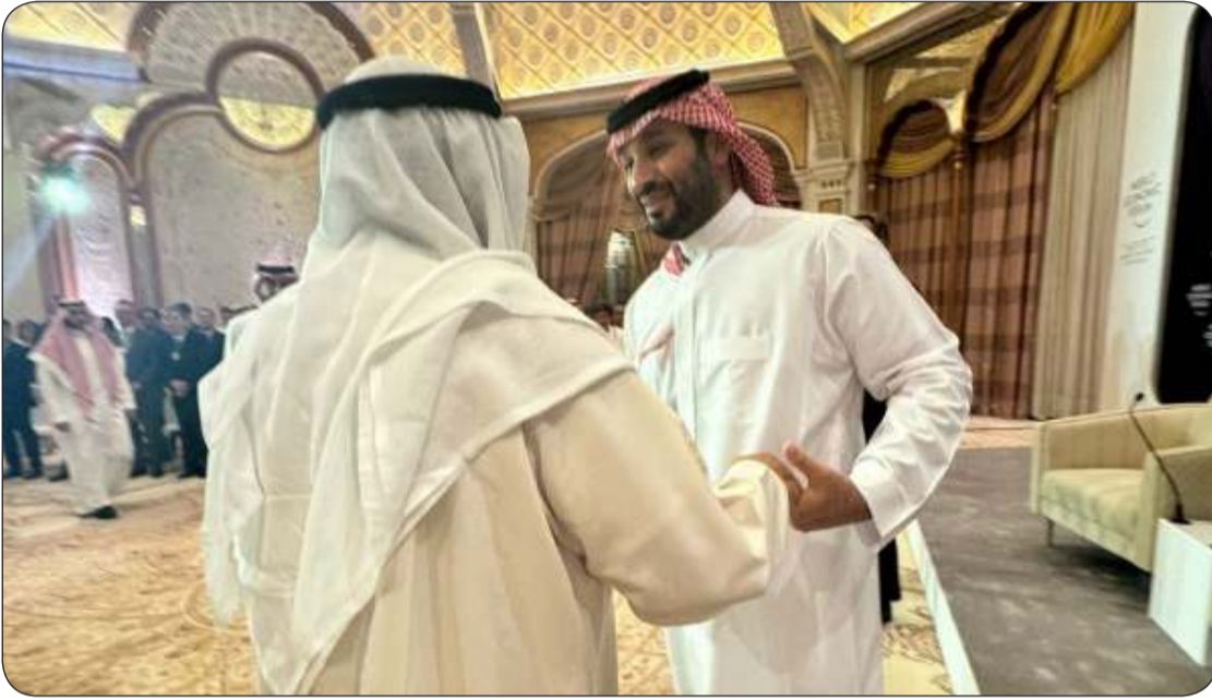
حفاوة كبيرة من ولي عهد المملكة بصاحب السمو

صاحب السمو والأمير محمد بن سلمان بحثا سبل دعم العلاقات وتعزيزها وتطويرها