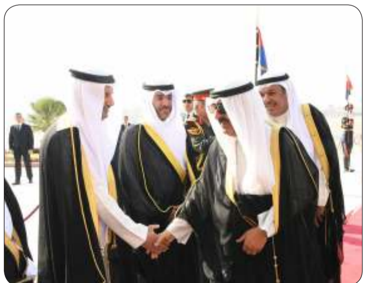
سمو الأمير مصافحا أعضاء البعثة الدبلوماسية الكويتية في القاهرة