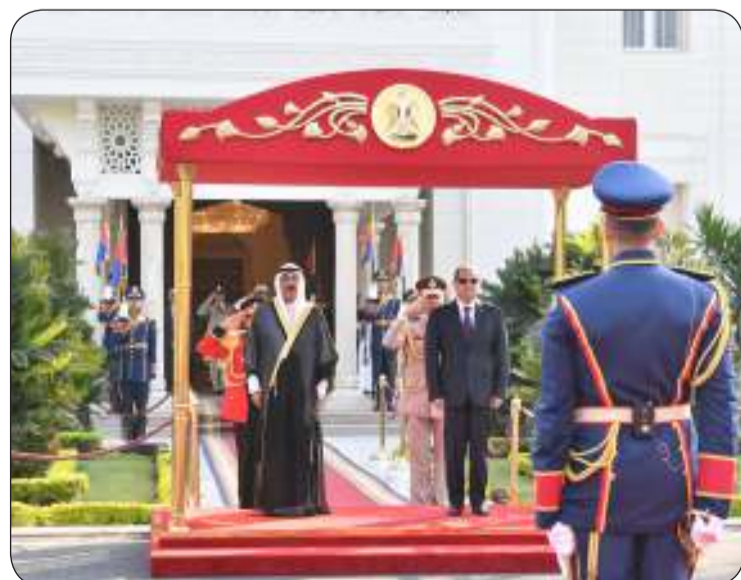
الأمير يستعرض حرس الشرف

كما تناولت المباحثات خلال هذه الزيارة دعم مسيرة العمل العربي المشترك التي تجمع الدول العربية الشقيقة وسبل تطوير العلاقات بينهم في المجالات كافة وإبراز القضايا ذات الاهتمام المشترك ومناقشة عدد من الأمور في ضوء مستجدات الأحداث والتطورات الجارية على الساحتين الإقليمية والدولية. وساد جلسة المباحثات