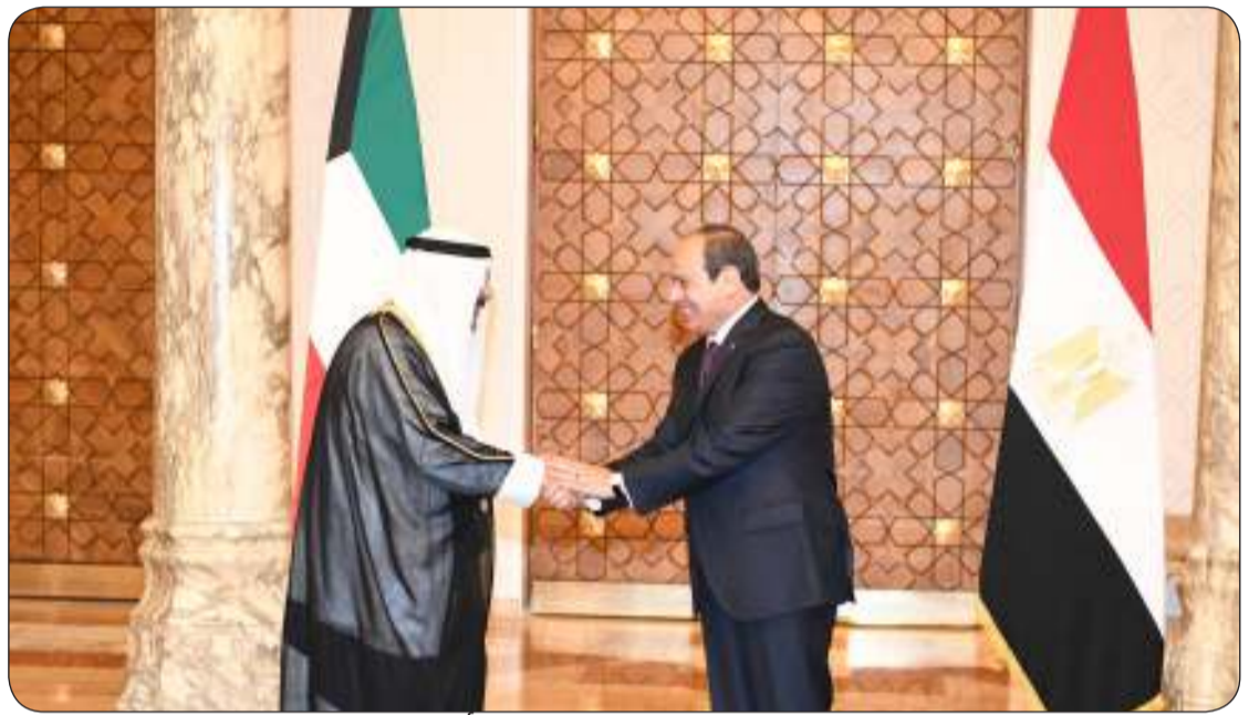
الرئيس المصري مرحبا بسمو أمير البلاد

محمد الصباح رئيس مجلس الوزراء المكلف بتصريف الأمور، نائب رئيس الحرس الوطني الشيخ فيصل النواف، ونائب رئيس مجلس الوزراء ووزير الدفاع ووزير الداخلية بالوكالة الشيخ فهد اليوسف، ووزير شؤون الديوان الأميري الشيخ محمد عبدالله، ونائب رئيس مجلس الوزراء ووزير الدولة لشؤون مجلس الوزراء شريفة عبدالله المعوشرجي، ونائب رئيس مجلس الوزراء ووزير النفط الدكتور عماد محمد العتيقي وكبار المسؤولين بالدولة.