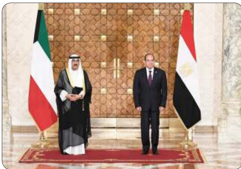
الرئيس المصري أقام مأدبة عشاء على شرف سمو الأمير

الخارجية عبدالله الحيا وكبار المسؤولين بالديوان الأميري.. رافقت سموه السلامة في الحل والترحال. وكان صاحب السمو قد غادر والوفد الرسمي المرافق لسموه أرض الوطن ظهر أمس متوجها إلى جمهورية مصر العربية الشقيقة وذلك في زيارة دولة، إذ كان في وداع سموه أرض المطار نائب الأمير الشيخ أحمد عبدالله رئيس مجلس الوزراء المكلف بتشكيل الحكومة وسمو الشيخ ناصر المحمد، وسمو الشيخ صباح خالد، وسمو الشيخ الدكتور