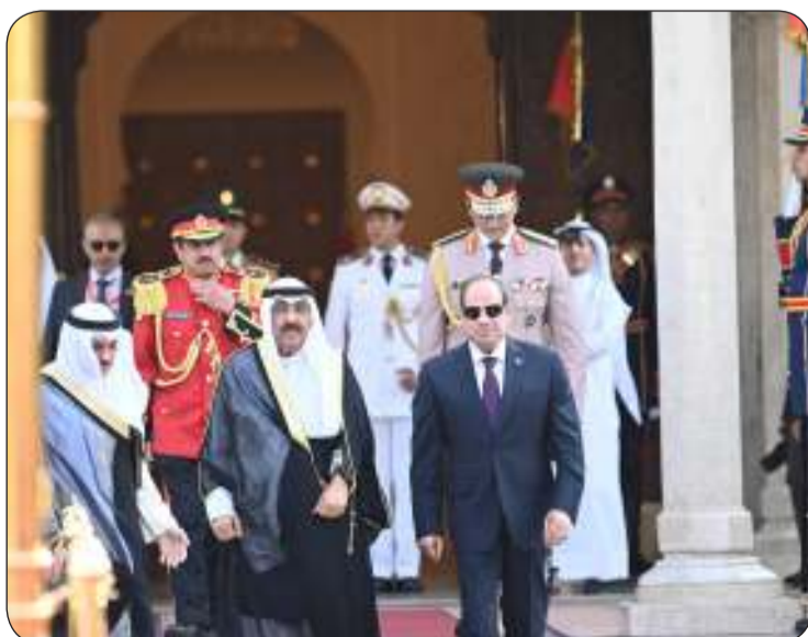
من مراسم زيارة الدولة التي أقيمت لصاحب السمو