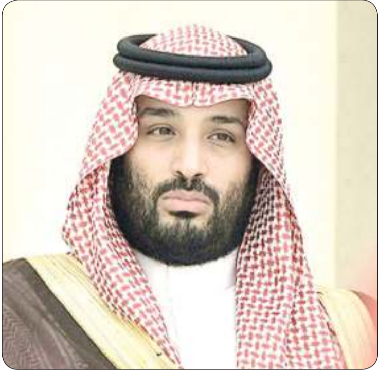
■ ولي العهد السعودي