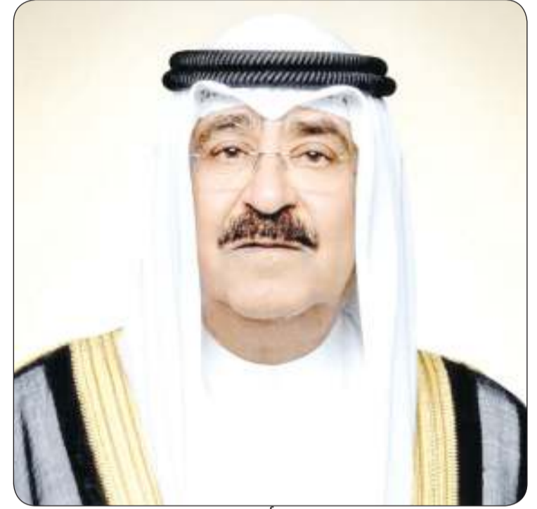
■ سمو أمير البلاد

الرئيس أندريه دودا رئيس جمهورية بولندا الصديقة عبر فيها سموه عن خالص تهنئته بمناسبة العيد الوطني لبلاده، متمنيا سموه له موفور الصحة والعافية ولجمهورية بولندا وشعبها الصديق كل التقدم والأزدهار. وبعث سمو الشيخ الدكتور محمد الصباح رئيس مجلس الوزراء المكلف بتصريف العاجل من الأمور ببرقية تعزية مماثلتين.