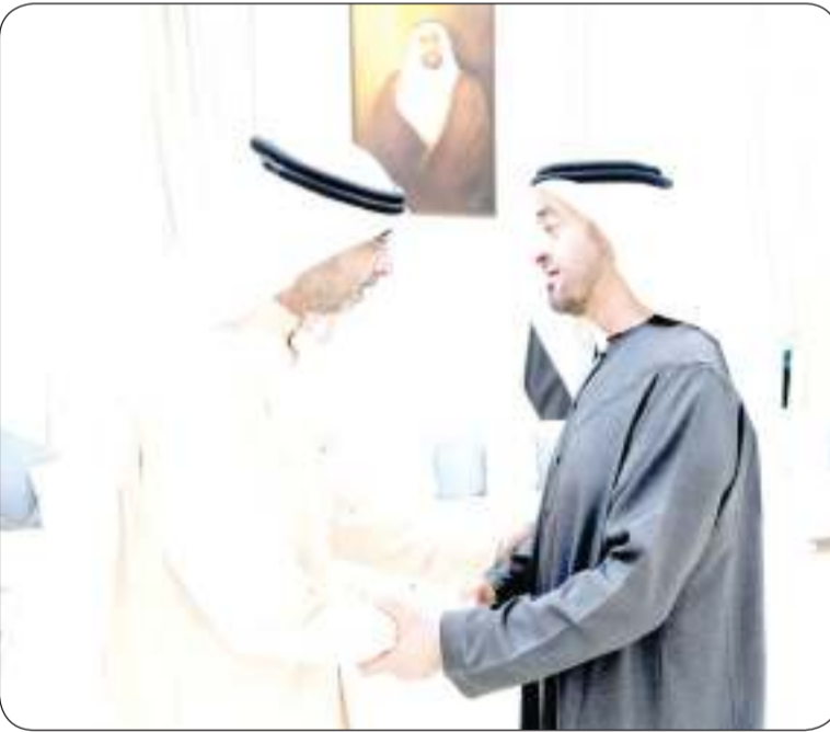
■ ممثل سمو الأمير يقدم واجب العزاء لرئيس الإمارات بوفاة طحنون بن زايد

أبو ظبي - «كونا»: قام ممثل سمو أمير البلاد الشيخ مشعل الأحمد، ووزير شؤون الديوان الأميري الشيخ محمد العبدالله أمس بتقديم واجب العزاء إلى صاحب السمو الشيخ محمد بن زايد آل نهيان رئيس دولة الإمارات العربية المتحدة الشقيقة وأسرة آل نهيان الكرام بوفاة المغفور له بإذن الله تعالى سمو الشيخ طحنون بن محمد آل نهيان ممثل الحاكم في منطقة العين طيب الله ثراه وجعل الجنة مثواه وذلك في قصر المشرف بالعاصمة أبو ظبي.