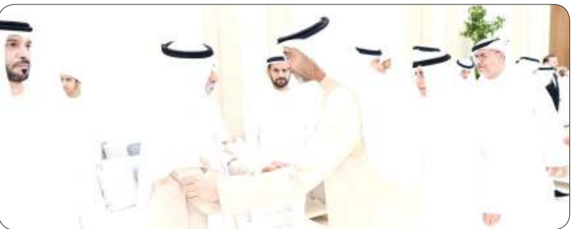
■ ويقدم العزاء لأسرته

وكان ممثل صاحب السمو غادر أمس متوجها إلى دولة الإمارات العربية المتحدة الشقيقة لتقديم واجب العزاء بوفاة المغفور له بإذن الله تعالى سمو الشيخ طحنون بن محمد آل نهيان ممثل الحاكم في منطقة العين طيب الله ثراه وجعل الجنة مثواه.