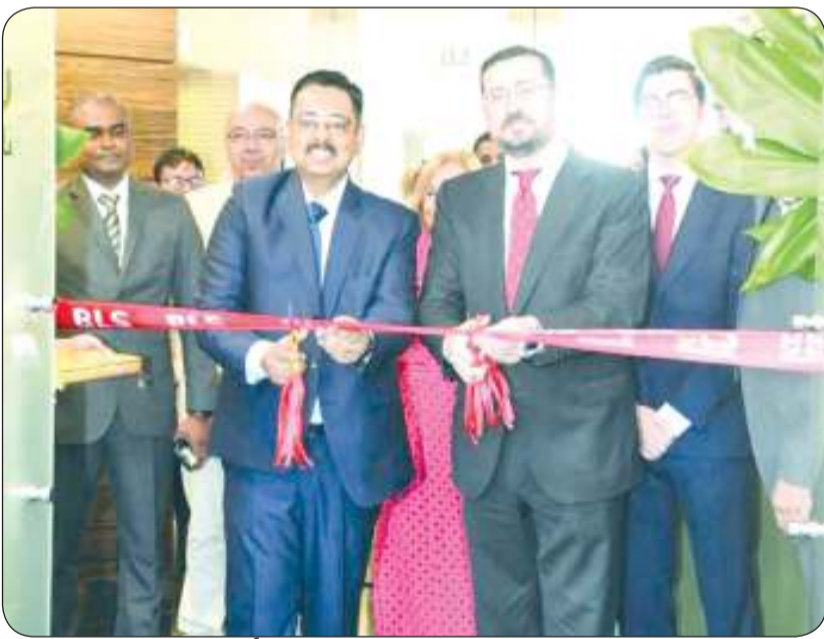
■ السفير الإسباني خلال افتتاحه مركز التأشيرات الجديد

نحن بانتظار التأكيد من الكويت لإعادة افتتاح خط الطيران المباشر لمدريد