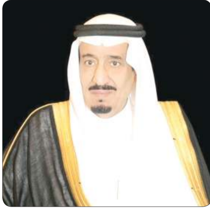
■ خادم الحرمين الشريفين