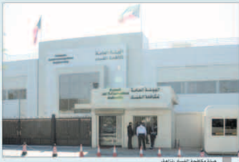
هيئة مكافحة الفساد «نزاهة».

قالت الهيئة العامة لمكافحة الفساد «نزاهة» أمس أنها تلقت 13 بلاغا عن شبهات فساد وذلك عبر البريد الإلكتروني خلال فترة تعطيل أعمال الجهات الحكومية التي أقرها مجلس الوزراء جراء تفشي وباء كورونا المستجد «كوفيد - 19».