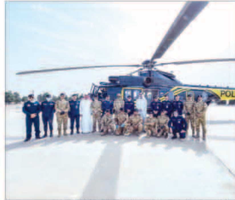
ويرة لحظة جماعية مع قيادات وزارة الداخلية والعاملين في النشاط الأمنية