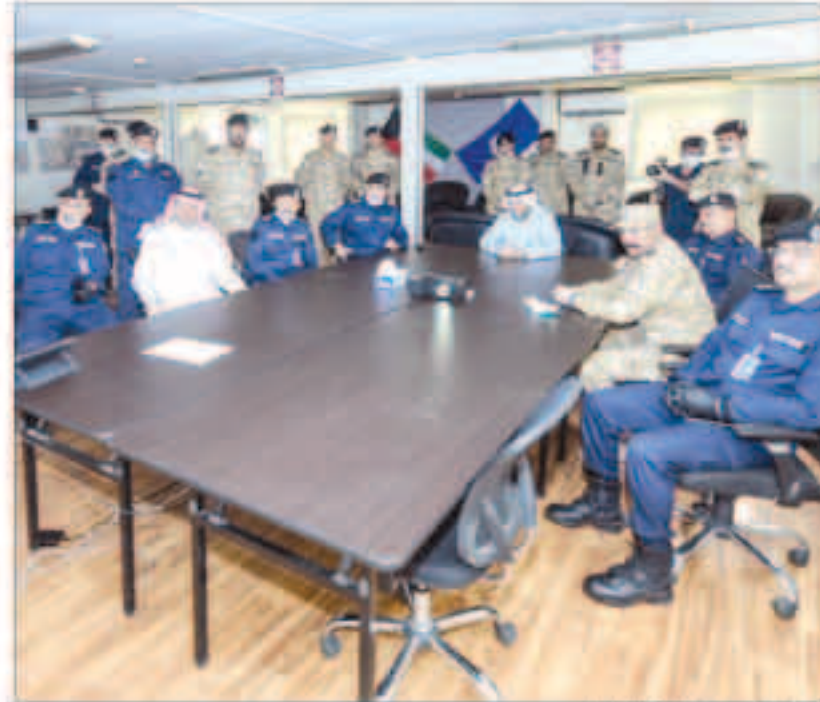
ويرة غرفة العمليات

قام نائب رئيس مجلس الوزراء ووزير الداخلية ووزير الدولة لشؤون مجلس الوزراء أنس الصالح أمس الأول بتفقد المحاجر الصحية ومراكز الإيواء في منطقة الرتقة ومركز عمليات أمن الحدود البرية. وتكررت الإدارة العامة للعمليات والإعلام الأمني بهـ«الداخلية» في بيان صحفي أن الصالح اطلع خلال تفقده للمحاجر الصحية ومراكز