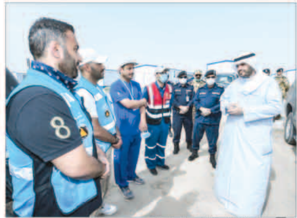
وزير الداخلية خلال جولته التفتيشية في محاجر «الرتقة».

شكراً لجميع رجال الأمن على اليقظة والانتباه وعدم التهاون في تطبيق أحكام قانون الحظر على الجميع