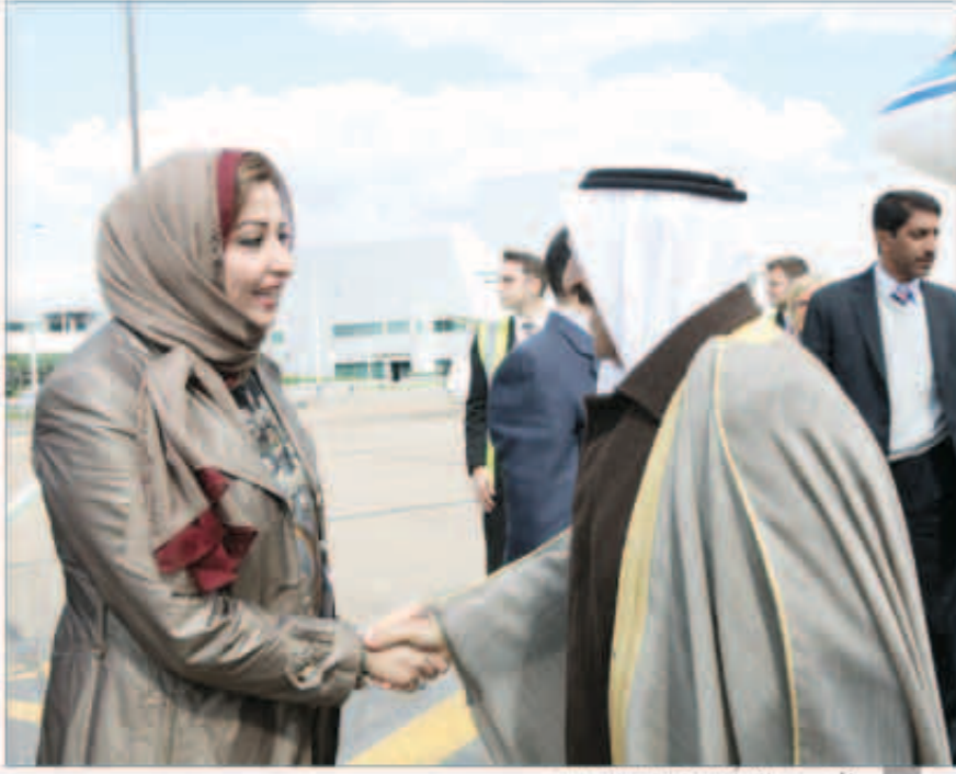
الأمير مصافحا الوزيرة الكبرى الرشيدية