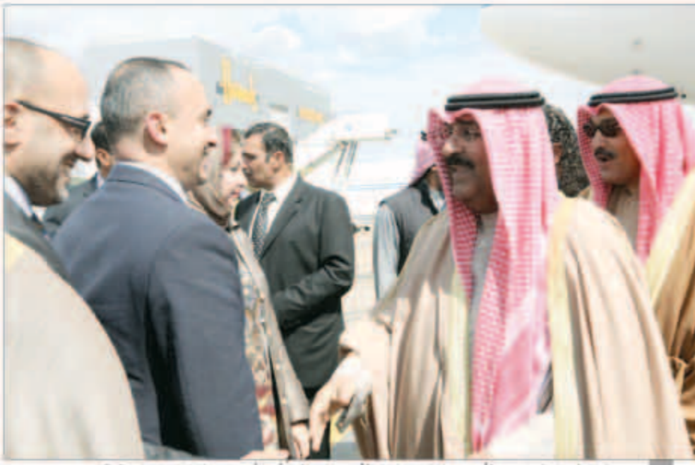
وصول الوفد المرافق لسمو الأمير... والشيخ مشعل الأحمد مصافحا أحد أعضاء بعثتنا الدبلوماسية في لندن

لندن - «كونا»: وصل سمو أمير البلاد الشيخ صباح الأحمد برفقة نائب رئيس الحرس الوطني الشيخ مشعل الأحمد والوفد المرافق لسموه ظهر أمس إلى المملكة المتحدة الصديقة وذلك في زيارة خاصة. وكان في استقبال سموه على أرض المطار رئيس مجلس الأمة السابق جاسم الخرافي ووزير الشؤون الاجتماعية والعمل ذكري الرشيد وسفير الكويت لدى المملكة المتحدة خالد الدويسان ورؤساء المكاتب الكويتية المعتمدة في المملكة المتحدة وأعضاء السفارة. رافقت سموه السلامة في الحل والترحال. وبعث سمو أمير البلاد الشيخ صباح الأحمد ببرقية تهنئة إلى الرئيس حامد كرزاي رئيس جمهورية أفغانستان الإسلامية عبر فيها سموه عن خالص تهنئته بمناسبة العيد الوطني لبلاده متمنياً لفخامته موفقاً الصحة والعافية وللبلد الصديق دوام التقدم والازدهار. وبعث سمو نائب الأمير وولي العهد الشيخ نواف الأحمد وسمو الشيخ جابر المبارك رئيس مجلس الوزراء ببرقيتي تهنئة مماثلتين.