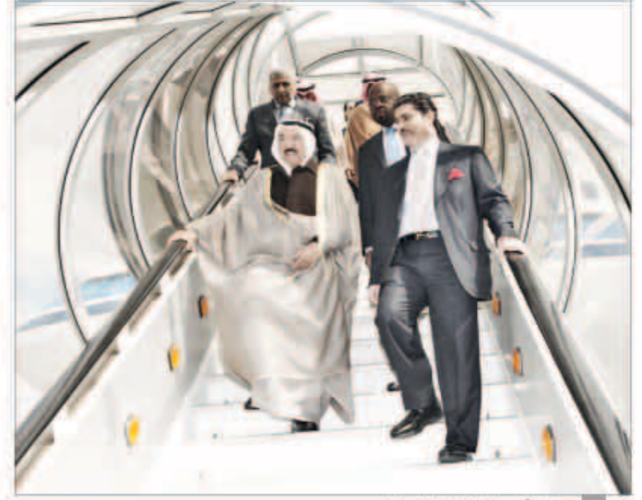
سمو الأمير في زيارة خاصة إلى لندن