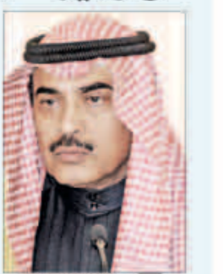
الشيخ صباح الخالد

تسلم رئيس مجلس الوزراء بالإنابة وزير الخارجية الشيخ صباح الخالد أمس رسالة خطية من وزير خارجية جمهورية مصر العربية تبين فهمي تتعلق بالعلاقات الثنائية بين البلدين الشقيقين بالإضافة إلى القضايا محل الاهتمام المشترك ومجمل التطورات والمستجدات في المنطقة. جاء ذلك خلال لقاء الشيخ صباح الخالد سفير جمهورية مصر العربية لدى البلاد عبدالكريم سليمان في قصر السيف ظهر أمس بحضور المدير بالإنابة لإدارة مكتب نائب رئيس مجلس الوزراء وزير الخارجية الوزير المفوض صالح سالم الوغاني. وتلقى رئيس مجلس الوزراء بالإنابة وزير الخارجية الشيخ صباح الخالد رسائل خطية من كل من وزير خارجية جمهورية بلغاريا كريستيان فيغيتين ووزير الخارجية والسنغاليين المغتربين في جمهورية السنغال منكار أنجاي ووزير خارجية جمهورية غينيا بيساو فير ناندو فيلبيدا سيلفيا تتعلق بسبل توطيد العلاقات الثنائية بين دولة الكويت وتلك الدول.