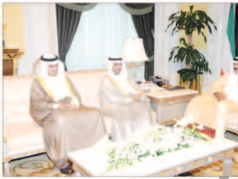
سموه خلال استقباله الحجرف والصالح

استقبل سمو نائب الأمير ولي العهد الشيخ نواف الأحمد في ديوانه بقصر السيف صباح أمس رئيس مجلس الوزراء بالإنابة وزير الخارجية الشيخ صباح الخالد ومبعوث رئيس وزراء ماليزيا رئيس المنتدى الاقتصادي الإسلامي العالمي تون موسى شيام والوفد المرافق له وسفير المملكة المتحدة لدى الكويت فرانك بيكر أوبي حيث سلم المبعوث لسموه دعوة من رئيس وزراء ماليزيا إلى سمو أمير البلاد الشيخ صباح الأحمد تتضمن دعوة سموه لحضور المنتدى الاقتصادي الإسلامي العالمي والذي سوف يقود في المملكة المتحدة لندن خلال الفترة من 29 - 31 أكتوبر 2013. كما قام سفير المملكة المتحدة لدى دولة الكويت بتقديم رسالة من رئيس وزراء بريطانيا ديفيد كامبرون إلى سمو أمير البلاد لحضور المؤتمر. هذا وقد حضر المقابلة المستشار بالديوان الأميري خالد يوسف الفليح ووكيل ديوان سمو ولي العهد للشؤون الإعلامية الشيخ مبارك الحمود السلطان الصباح وسفير ماليزيا لدى الكويت داتو عدنان حاجي عثمان. وتلقى سمو نائب الأمير وولي العهد الشيخ نواف الأحمد اتصالاً هاتفياً من أخيه نائب رئيس