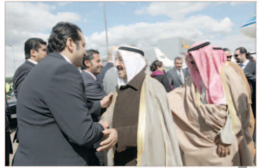
ترحيب كبير بصاحب السمو

لندن - «كونا»: وصل سمو أمير البلاد الشيخ صباح الأحمد برفقة نائب رئيس الحرس الوطني الشيخ مشعل الأحمد والوفد المرافق لسموه ظهر أمس إلى المملكة المتحدة الصديقة وذلك في زيارة خاصة. وكان في استقبال سموه على أرض المطار رئيس مجلس الأمة السابق جاسم الخرافي ووزير الشؤون الاجتماعية والعمل ذكري الرشيد وسفير الكويت لدى المملكة المتحدة خالد الدويسان ورؤساء المكاتب الكويتية المعتمدة في المملكة المتحدة وأعضاء السفارة. رافقت سموه السلامة في الحل والترحال. وبعث سمو أمير البلاد الشيخ صباح الأحمد ببرقية تهنئة إلى الرئيس حامد كرزاي رئيس جمهورية أفغانستان الإسلامية عبر فيها سموه عن خالص تهنئته بمناسبة العيد الوطني لبلاده متمنياً لفخامته موفقاً الصحة والعافية وللبلد الصديق دوام التقدم والازدهار. وبعث سمو نائب الأمير وولي العهد الشيخ نواف الأحمد وسمو الشيخ جابر المبارك رئيس مجلس الوزراء ببرقيتي تهنئة مماثلتين.