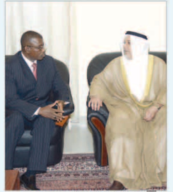
الشيخ علي الجراح يقدم التعازي

قام نائب وزير شؤون الديوان الأميري الشيخ علي الجراح بزيارة إلى سفارة جمهورية بوركيننا فاسو الصديقة لدى الكويت حيث نقل تعازي صاحب السمو أمير البلاد الشيخ صباح الأحمد وسمو نائب الأمير ولي العهد الشيخ نواف الأحمد وشعب الكويت بوفاة الرئيس الأسبق لجمهورية بوركيننا فاسو سايب زيربو.