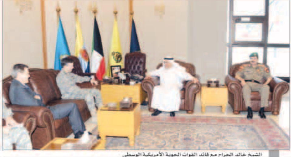
الشيخ خالد الجراح مع قائد القوات الجوية الأمريكية الوسطى

الأحدث الودية ومناقشة المواضيع ذات الاهتمام المشترك لاسيما المتعلقة بالجوانب العسكرية. وأشاد الوزير الجراح بعقد العلاقات بين البلدين الصديقين وحرص الطرفين على تعزيزها وتطويرها.