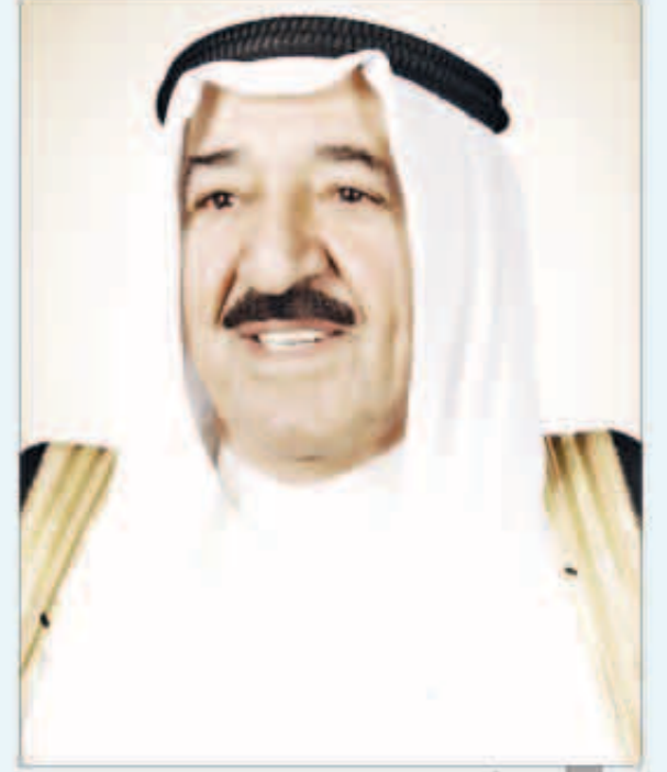
سمو أمير البلاد

بعث صاحب السمو أمير البلاد الشيخ صباح الأحمد بمرقية تعزية إلى الرئيس ممنون حسين رئيس جمهورية باكستان الإسلامية عبر فيها سموه عن خالص تعازيه وصادق مواساته بضحايا الزلزال الذي تعرضت لها عدة مناطق في جنوب باكستان والذي أسفر عن سقوط العديد من الضحايا والمصابين والمفقودين سائلا سموه المولى تعالي أن يتغمد الضحايا بواسع رحمته ويسكنهم فسيح جناته وأن يمن على المصابين بسرعة الشفاء والعافية.