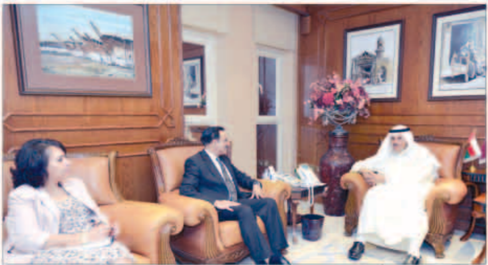
الحمود مستقبلا منسق الأمم المتحدة مبشر رياض

التعاون الثنائي بين دولة الكويت والإم المتحدة، وشدد الشيخ سلمان خلال اللقاء على ضرورة تفعيل البرامج المشتركة وتبادل الخبرات والزيارات والوفود وفق عدد من البرامج ذات الاهتمام المشترك وبما يصب في خدمة الطرفين.