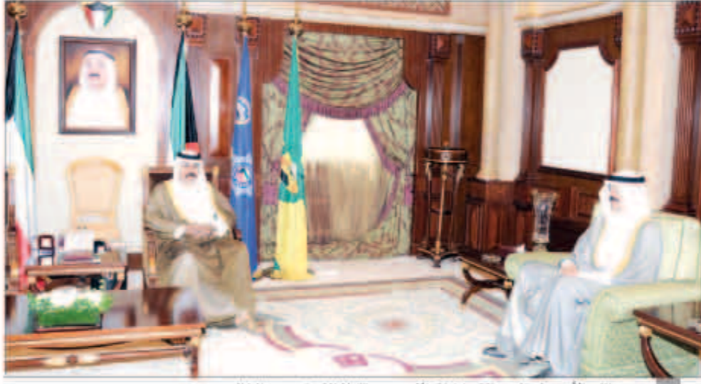
سمو نائب الأمير ولي العهد الشيخ نواف الأحمد مستقبلا الشيخ محمد الخالد

مبارك الحمود ووكيل ديوان سمو ولي العهد لشؤون المراسم والتشريفات الشيخ مبارك صباح السالم، واستقبل سمو نائب الأمير ولي العهد بقصر بيان السفير د.رشيد الحمد.