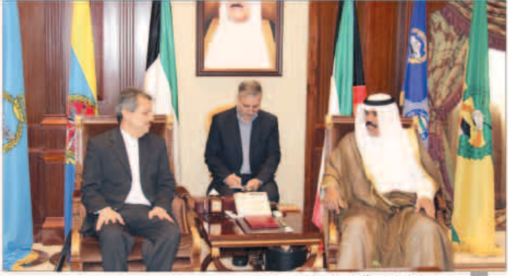
سموه مستقبلا السفير الإيراني لدى الكويت