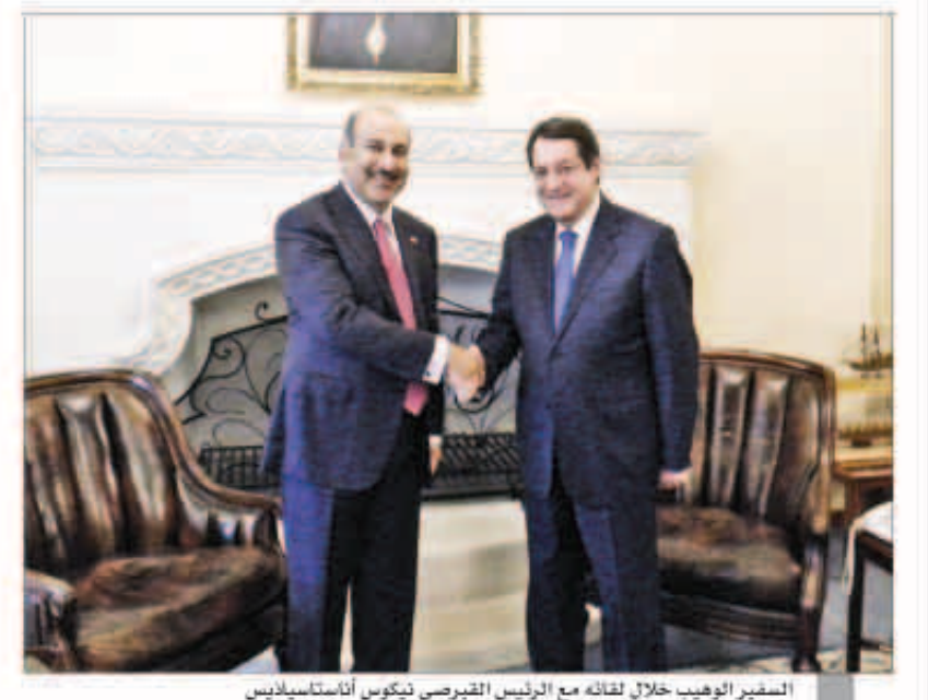
السفير الوهيب خلال لقائه مع الرئيس القبرصي نيكوس أناستاسياديس

بيروت - «كونا»: قال سفير دولة الكويت لدى جمهورية قبرص أحمد الوهيب أمس، ان زيارة الرئيس القبرصي نيكوس أناستاسياديس لدولة الكويت الأسبوع المقبل تعتبر تاريخية ومنعطفاً مهماً في مسيرة العلاقات بين البلدين. وأوضح السفير الوهيب في تصريح لـ «كونا» عقب لقائه الرئيس القبرصي نيكوس أناستاسياديس بمناسبة زيارته المرتقبة للكويت في الثامن من الشهر الجاري ان هذه الزيارة تأتي تنويعاً لما شهدته العلاقات الثنائية من تطور خاصة بعد انضمام قبرص للاتحاد الأوروبي وافتتاح سفارتين للبلدين الصديقين. وأشار الى انه من المقرر ان تشهد الزيارة عقد مباحثات ثنائية تتناول سبل تعزيز وتعميق العلاقات الثنائية في مختلف المجالات لاسيما على المستويين الاقتصادي والاستثماري بالإضافة الى بحث المواقف فيما يتعلق بالقضايا الإقليمية