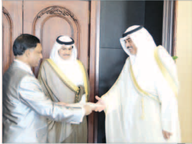
الشيخ صباح الخالد يتسلم أوراق اعتماد سفير بنغلاديش

جمهورية كوبا برونو رودريغيز باريل. وقال بيان صادر عن وزارة الخارجية ان الرسالة التي سلمها سفير جمهورية كوبا الجديد لدى البلاد اندرس مارسيلو جاريدو «تتصل بسبل توطيد العلاقات الثنائية بين البلدين الصديقين في كافة المجالات».