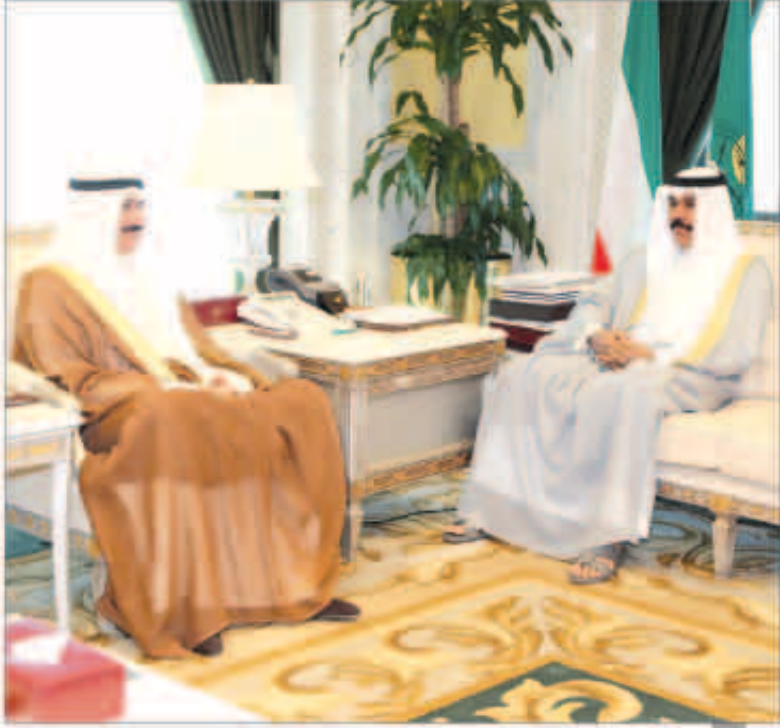
سموه مستقبلا الشيخ سالم العبدالعزیز