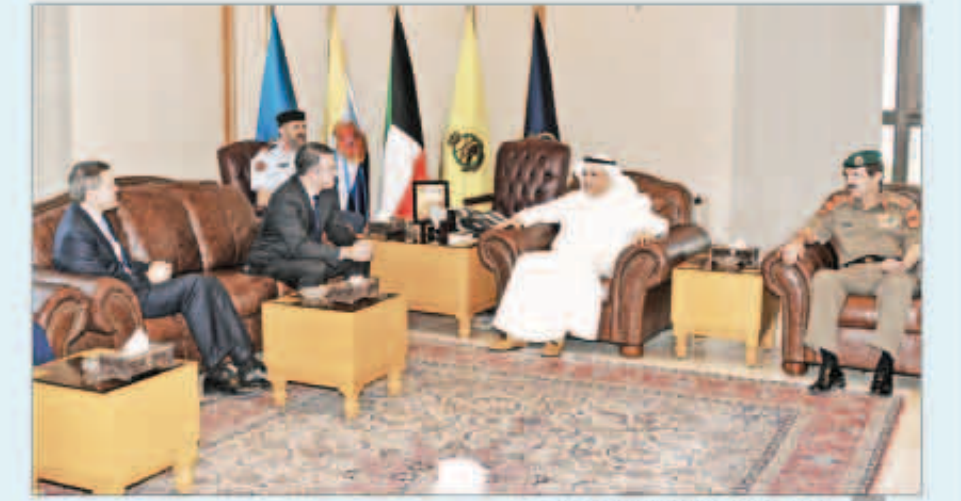
الشيخ خالد الجراح مستقبلا روزنيك

استقبل نائب رئيس مجلس الوزراء وزير الدفاع الشيخ خالد الجراح بمكتبه أمس، نائب مساعد وزير الدفاع الأمريكي رئيس سياسة الحماية ضد الهجمات الإلكترونية إيريك روزنيك، برفقه مدير القيادة والسيطرة والاتصالات العميد جون بايكر، وذلك بمناسبة زيارته للبلاد، كما رافق الضيف خلال الاستقبال سفير الولايات المتحدة الأمريكية لدى الكويت ماثيو تولر، وتم خلال اللقاء تبادل الأحاديث الودية، ومناقشة أهم الأمور والمواضيع ذات الاهتمام المشترك، لاسيما المتعلقة بالجوانب العسكرية، مشيداً بعمق العلاقات الثنائية بين البلدين الصديقين وحرص الطرفين على تعزيزها وتطويرها. حضر اللقاء سعادة نائب رئيس الأركان العامة للجيش الفريق الركن عبدالرحمن محمد العثمان، ومعاون رئيس الأركان العامة لهيئة العمليات والخطط اللواء الركن عبدالرزاق العوضي.