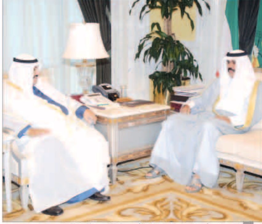
سمو نائب الأمير ولي العهد الشيخ نواف الأحمد مستقبلا سمو الشيخ ناصر المحمد

لدى باكو سعود شمالان الرومي، واستقبل سموه سفير الكويت لدى السنغال محمد فاضل خلف. كما استقبل سمو نائب الأمير ولي العهد سفير الكويت لدى مملكة أسبانيا سليمان عبدالمه الحربي.