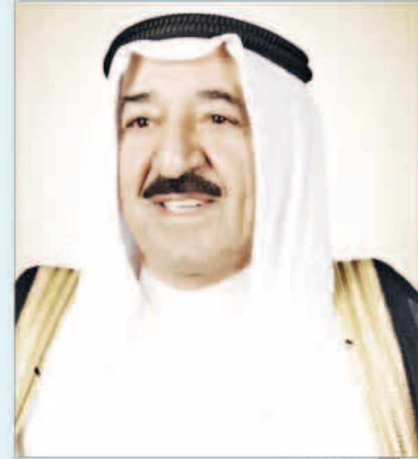
سمو أمير البلاد

بعث صاحب السمو أمير البلاد الشيخ صباح الاحمد ببرقية تهنئة الى الرئيس شي جين بينغ رئيس جمهورية الصين الشعبية عبر فيها سموه عن خالص تهنائه بمناسبة العيد الوطني لبلاده متمنياً له موفور الصحة والعافية وللبلد الصديق دوام التقدم والازدهار. وبعث سمو نائب الأمير ولي العهد الشيخ نواف الاحمد ببرقية تهنئة الى الرئيس شي جين بينغ رئيس جمهورية الصين الشعبية عبر فيها سموه عن خالص تهنائه بمناسبة العيد الوطني لبلاده متمنياً له موفور الصحة والعافية.