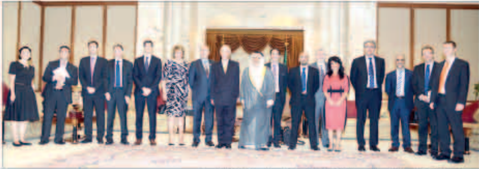
الشيخ علي الجراح مستقبلا وزير الصحة البرلماني بالمملكة المتحدة

استقبل نائب وزير شؤون الديوان الأميري الشيخ علي جراح الصباح في مكتبه بقصر السيف صباح أمس نائب وزير الديوان الأميري وزير الصحة البرلماني في المملكة المتحدة الموراد هاو والوفد المرافق وذلك بمناسبة زيارته للبلاد.