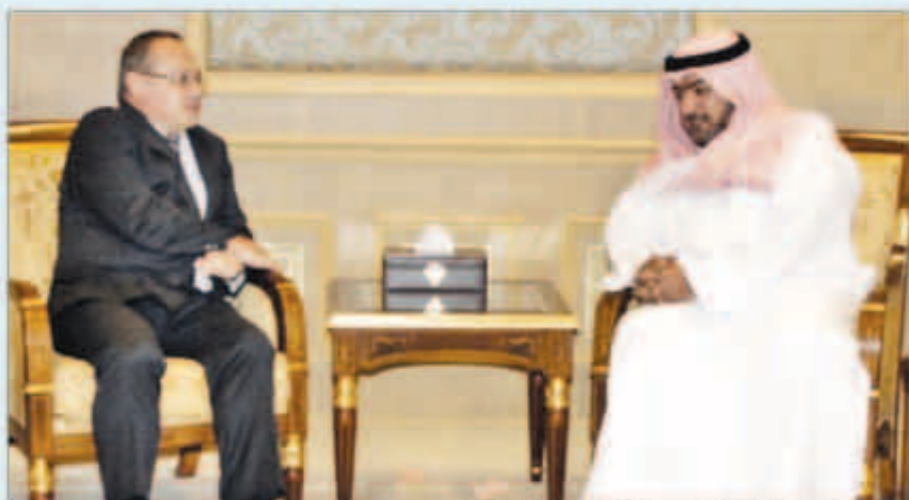
الشيخ ثامر العلي مستقبلاً سفير عمان لدى البلاد

على الساحتين الإقليمية والدولية. كما بحث الشيخ ثامر العلي مع سفير جمهورية هنغاريا الصديقية لدى البلاد فرنس تشيلاغ تعزيز التعاون بين البلدين الصديقين وسبل تطويرها. وتناول اللقاء بحث موضوعات ذات اهتمام مشترك وأهم القضايا التي تشهدها المنطقة.