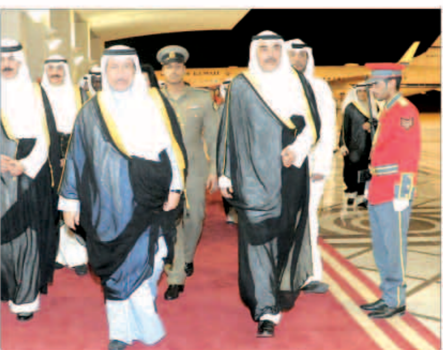
سمو الشيخ جابر المبارك أثناء عودته إلى البلاد

القضايا الدولية ذات الاهتمام المشترك. وكان في استقبال سموه على أرض مطار الكويت الدولي نائب رئيس مجلس الوزراء ونائب رئيس مجلس الوزراء وزير الداخلية الشيخ محمد الخالد ونائب رئيس مجلس الوزراء وزير الدفاع الشيخ خالد الجراح ونائب رئيس مجلس الوزراء وزير النفط مصطفي الشمالي ونائب رئيس مجلس الوزراء وزير المالية الشيخ سالم عبدالعزیز ووزير شؤون الديوان الاميري الشيخ علي الجراح وعدد من الشيوخ والوزراء والمحافظين والمستشارين بديوان سموه رئيس مجلس الوزراء وكبار قادة الجيش والشرطة والحرس الوطني وكبار المسؤولين بالدولة. من ناحية أخرى، تلقى سمو الشيخ جابر المبارك اتصالاً هاتفياً من رئيس الوزراء في جمهورية العراق الشقيق نوري المالكي. وجرى خلال الاتصال تبادل وجهات النظر حول عدد من الموضوعات ذات الاهتمام المشترك إضافة إلى سبل تعزيز العلاقات الثنائية بين البلدين لما فيه مصلحة الشعبين الشقيقين.