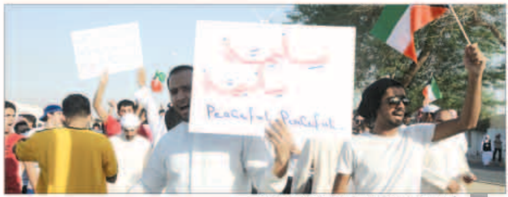
«أبناء» البدون يرفعون شعارات السلمية خلال تظاهرتهم