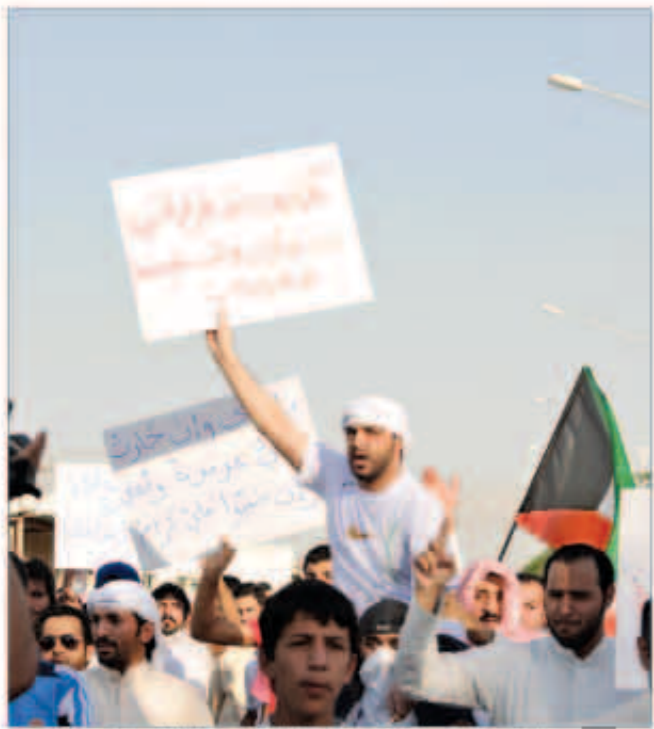
هتافات بضرورة حل القضية ورفع اعلام الكويت خلال المسيرات